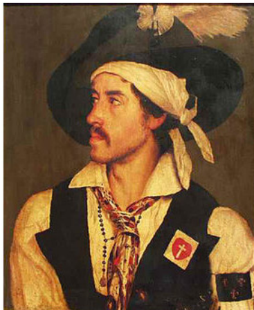
Жан Коттеро или Жан Шуан

Подобные процессы проходили и в других городах и селах Бретани, в департаменте Кот-дю-Нор, в Перрос-Гиреке, Сен-Ке, Трегье, Плубаланек, Ла-Рош-Дерьен, Плоэзаль и так далее. Собираются толпы крестьян, что с криками «Да здравствует Король!» выгоняют вербовщиков. Национальные гвардейцы избиваются и разоружаются.