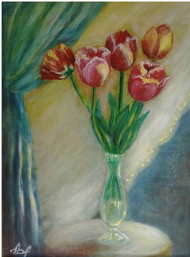
Тюльпаны, холст 30x40, масло