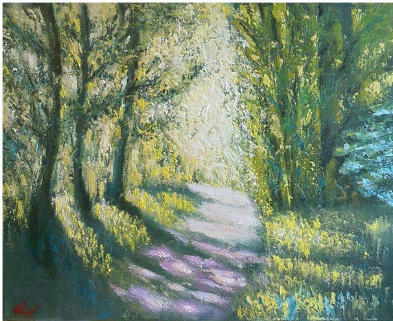
Солнечный день, холст 40x50, масло