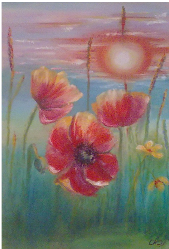
Рассвет в поле, холст 30x40, масло