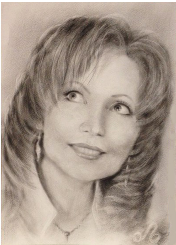
Автопортрет, бумага 30x40, сухая кисть, масло