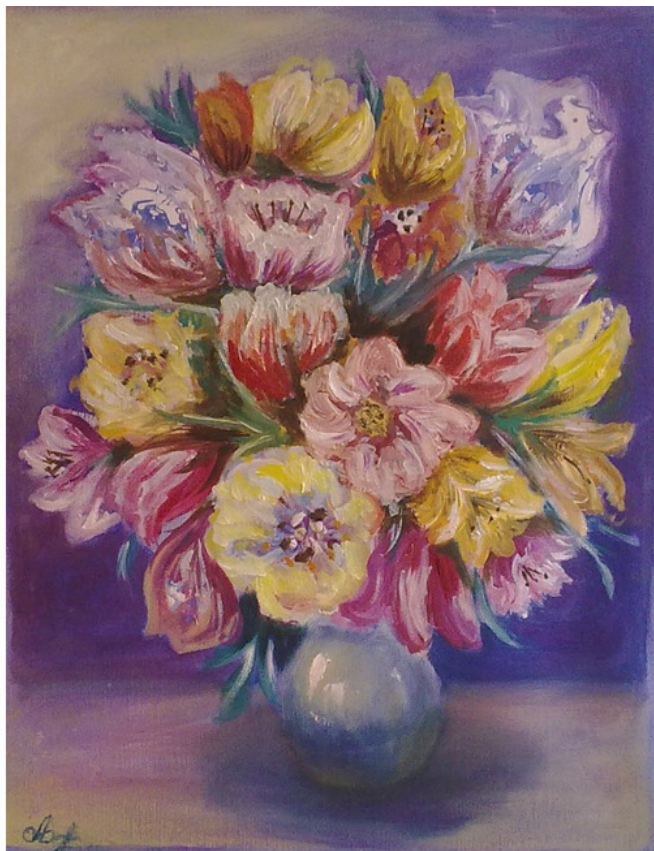
Букет, холст 40x50, масло