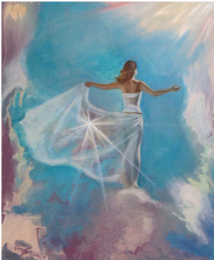
Свет, холст 50x60, масло