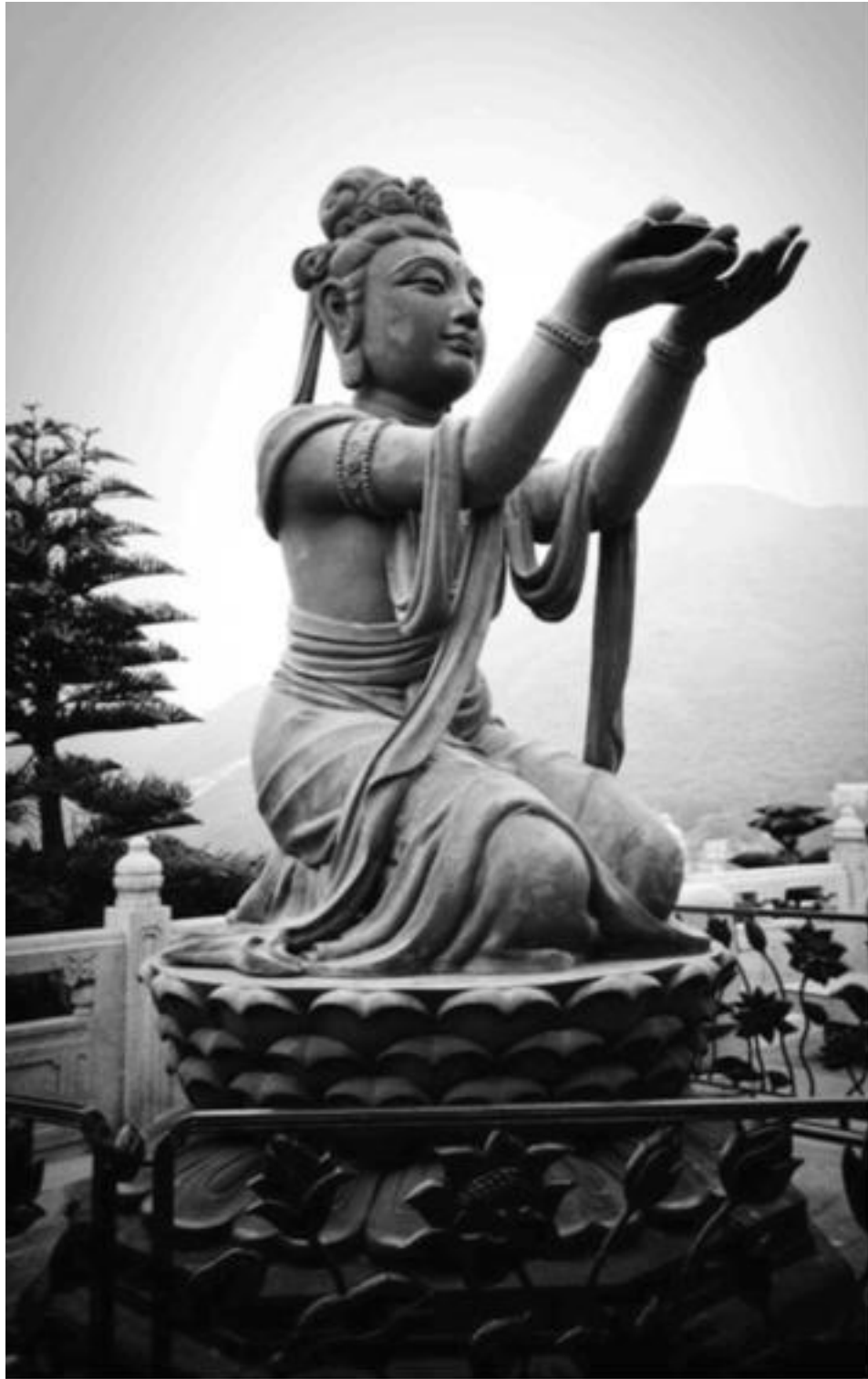
Будда. Острів Лантау Гонконг

Як визначити величину хоча б цієї ось пляшки? Порівняно з якимось мікробом, вона велика, але порівняно з Лісабоном – маленька. То велика вона чи маленька? І не велика, і не маленька, бо її величина залежить від того, з чим її порівнювати. А цей ось стіл – новий чи старий? Старий порівняно з цим аркушем паперу, але порівняно з Великою єгипетською пірамідою – новий. То новий цей стіл чи старий? Усе відносно.