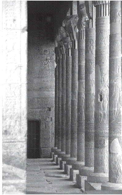
Храм Ісиди, о. Філе, Єгипет

А тепер поговоримо про книги. Ми говорили переважно про Рігведу – прекрасну книгу індійців. Можна згадати і Магабгарату і Бгагавад Гіту. Усі ці твори присвячені Богові. А сьогодні сноби, які мають себе за дуже сучасних людей, відкрили для себе Кама Сутру, якої індуїсти начиталися ще 1500 років тому, та й віддали її мусульманам. А сноби вважають її чи не найголовнішим твором минулого. Але якби вони почитали її на санскриті, в оригінальній версії, то натрапили б на оповіді про бога Каму, про те, як цей Бог створює Всесвіт і людей, як він, немов Купідон, метає свої стріли, лишаючи на тілі людей надчутливі точки, і це не так мало-релігійно, як то може видатися.