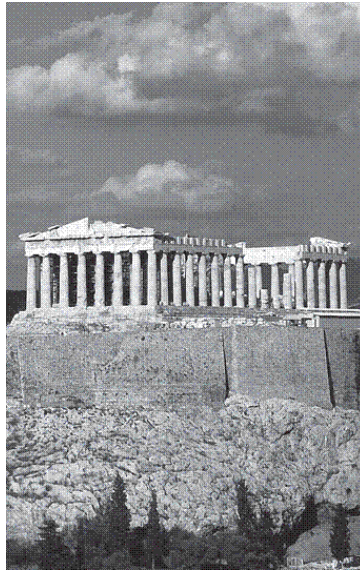
Парфенон на пагорбі Акрополя, Афіни, Греція

На жаль, не обізнані з нашими поглядами люди чіпляють нам ярлики комуністів, наці, чорносотенців і т. ін., використовуючи для того сторінки газет і журналів. Певне, їм бракує інших ярликів. Але ми цілком нове явище. Старісіньке як зернятко і новісіньке як квітка.