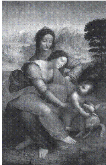
Леонардо да Вінчі «Мадонна з дитиною Христом та Святою Анною» Лувр, Париж

Колись я віршував, можливо, як і багато з присутніх у цій залі. Власне, поет не вимислює свої вірші; поет, якого навідує натхнення серед прегарних троянд у саду, під деревом чи в мерехтливому сяйві місяця, – постать досить романтична, але сумнівна. Поети це знають. Можна оточити себе всіма вищезгаданими атрибутами, але нічого не буде, у голові снуватимуться банальні рими. Натомість, смакуючи сандвіч або беручи ванну, на думку несподівано приходить прегарний вірш, який треба негайно покласти на папір, інакше він звіється з пам'яті. В якому потайнику природи, Бога чи нашої підсвідомості зароджуються і спадають нам на думку ці гармонійні форми у довершеному вигляді? З чого виникають книжки? З чого виникають картини? З чого виникають скульптури? Насправді ми лише виповнюємо їх матерією. Вони приходять звідтам, приходять з якогось світу, де більше гармонії, де більше істини, де більше краси. Саме таке мистецтво нам потрібне, саме такому мистецтву ми маємо сприяти, саме такого мистецтва ми, акрополітяни, прагнемо.