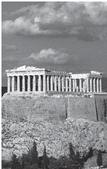
Парфенон на пагорбі Акрополя, Афіни, Греція

Акрополь – це ре-еволюція, повернення до принципів, до фундаментальних речей. Це не просто гурт молодих людей чи викладачів, якими рухає жага пізнання; це центр, де можна набути нових досвідчень і по-новому подивитися на світ. Це не щось суб'єктивне, це – досвідчення, абсолютно нове досвідчення.