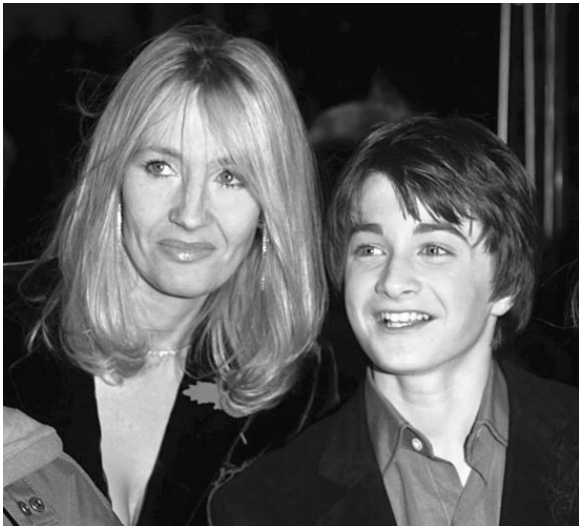
Писательница и Дэниел Рэдклифф.