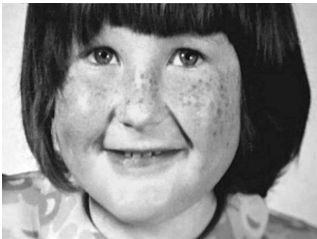
Джоан Роулинг в детстве.