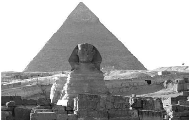
Египетские пирамиды и сфинкс

вероафриканском Средиземноморье уже существовали достаточно сформировавшиеся государственные образования в виде союзов номов (территориальных образований) Верхнего и Нижнего Египта. Египетские царства уже тогда выделялись среди древнейших государств обширной жреческой кастой, владевшей множеством храмов и святилищ. Там же и родилась знаменитая египетская «храмовая наука», одной из основных задач которой было предсказывание близкого и далекого будущего, прежде всего – разливов Нила.