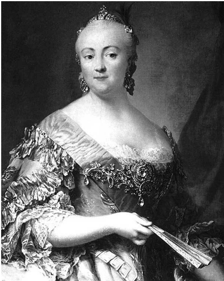
Елизавета I Петровна (1709–1761) – российская императрица из династии Романовых с 25 ноября (6