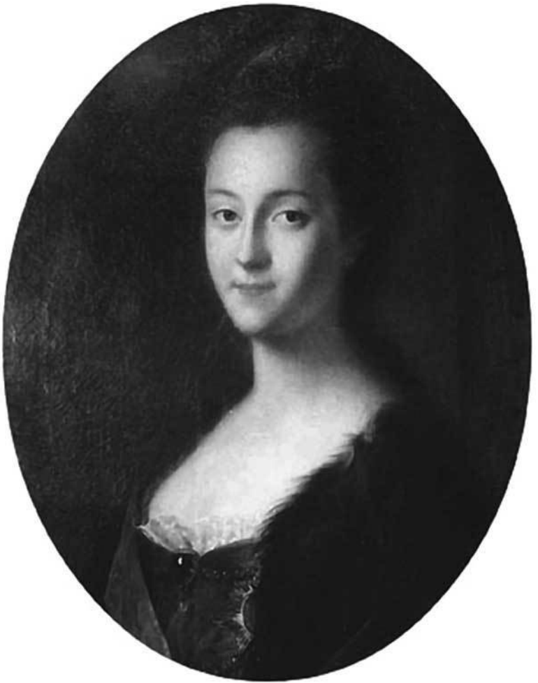
«Екатерина после приезда в Россию». Художник