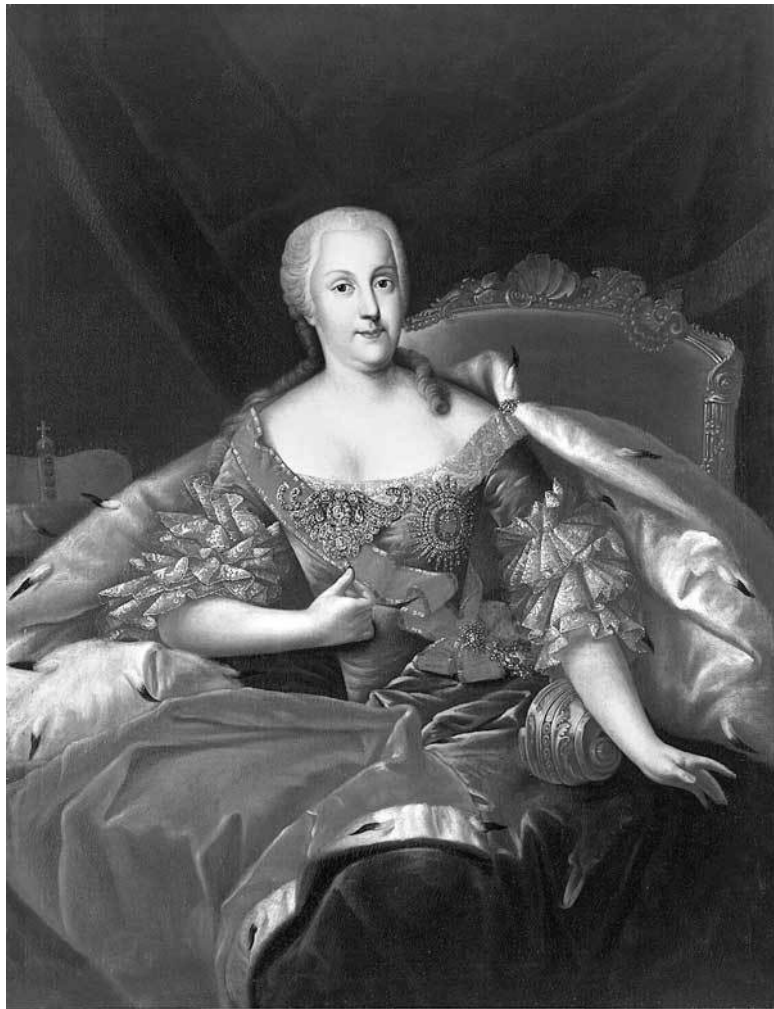
Иоганна Елизавета Гольштейн-Готторпская (1712–