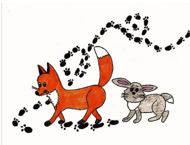
Проводник Лиса. Рис. А. Дубровиной

Зайцу, конечно, очень хотелось стать и хитрым, и ловким, и сообразительным, но уж больно болезненным был его опыт общения с Лисами. Он сильно задумался. Потом ещё задумался. Потом ещё... Нет, никак он не мог довериться Лисе.