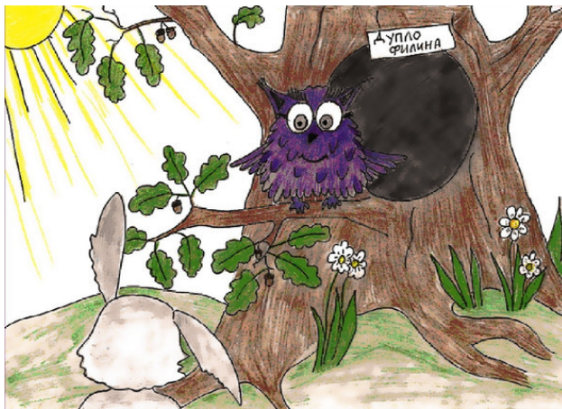
Заяц и Филин. Рис. А. Дубровиной

Он постарался тут же забыть неприятный сон, но тщетно! Пыхтел, сопел, но так ничего и не придумал. И вот, как-то ранним утром, в совершенно расстроенных чувствах, Заяц побежал к известному в лесу мудрецу – Филину, чтобы тот растолковал ему сон.