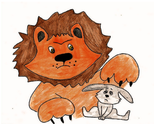
Проводник Лев. Рис А. Дубровиной

Филин продолжал, внимательно наблюдая за Зайцем.