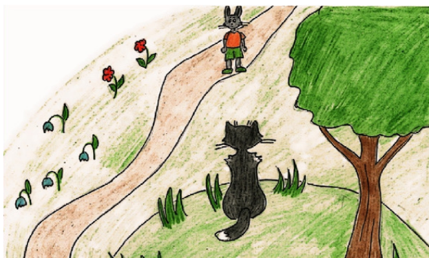
Встреча. Рис. А. Дубровиной

Заяц растерянно осматривался и, наконец, увидел Кота. Кот, приветливо улыбаясь, приближался к нему. Он внимательно рассматривал своего спутника, попутно читая его мысли. Заяц трясся от страха перед неизвестностью, и глаза его стали совсем косыми от обилия мыслей в голове.