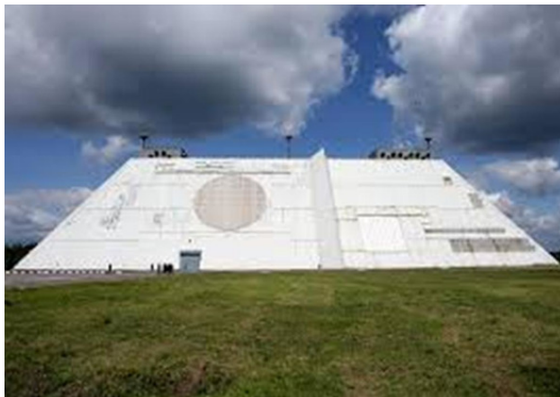
Многофункциональная РЛС типа Дон

церам, которые стояли у истоков этих систем ПРО и вводили их в боевой режим. Было это совсем не просто. Но мы делали это. Чем, по настоящему, и гордились.