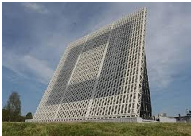
Антенные системы РЛС типа Воронеж

По принципам построения систем ПРН, такие станции должны быть и на Западе, и на Востоке. Через полярную шапку эти РЛС прекрасно просматривали всю территорию нашего вероятного противника, все его ракетные базы. На других снимках – элементы современной системы ПРН, станция нового поколения типа Воронеж. Какие впечатляющие здесь антенные системы.