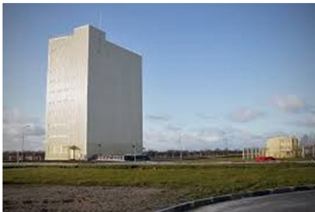
РЛС типа Воронеж

гичные задачи, что и станция типа Дунай – 3М, что в Кубинке. Только направления противоположные. На двух нижних снимках – станции надгоризонтного обнаружения и сопровождения систем ПРН, типа Дарьял. Много их настроено по всей нашей территории. Надежные, отличные станции. Много наших выпускников ВИРТА проходило службу на этих системах – на Балхаше, в Печоре, Скрунде, Мингечауре. Вот они мингечаурская станция, станция в Мукачево. Кстати, действуют эти станции и поныне. Сложнейшие системы радиолокации. Так и служить в этих системах было архи интересно.