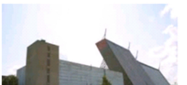
РЛС НГО типа Дунай 3У

Все новое, передовое. Иногда приятно осознавать, что лично сам стоял на передовых рубежах защиты страны, принимал самое активное участие в становлении новейших систем ПРО и ПРН. И ещё один представитель современной системы ПРН – загоризонтная станция типа Контейнер. А эта красивая усеченная пирамидка в зеленом окружении, не что иное, как многофункциональный радиотехнический узел дальнего обнаружения системы ПРО. Многофункциональный потому, что видит во все стороны – на запад, на восток, на север и на юг. Расположен в подмосковном Софрино. Заменял в свое время и кубинский, и чеховский узлы. Далее ещё снимок – та же станция, но только поближе. Покрасить её бы, а то не очень смотрится с этой ржавчиной. Хотя, в принципе, там гостей не бывает. Разве только из космоса на её смотрят наши противники. Станция несет круглосуточное дежурство. Да и свч излучение там, наверное, приличное. А может не красят, потому, что дорого. Ведь покраска техники всегда входила в обязательный перечень, выполняемый при регламентных работах. К сведению. В наше время покраска передающей антенны при сезонных работах кубинского узла стоила около 400 т. полновесных советских рублей. Это равноценно тогда было $400000 по тогдашнему курсу. Или даже немного повыше. Деньги, конечно, находили.