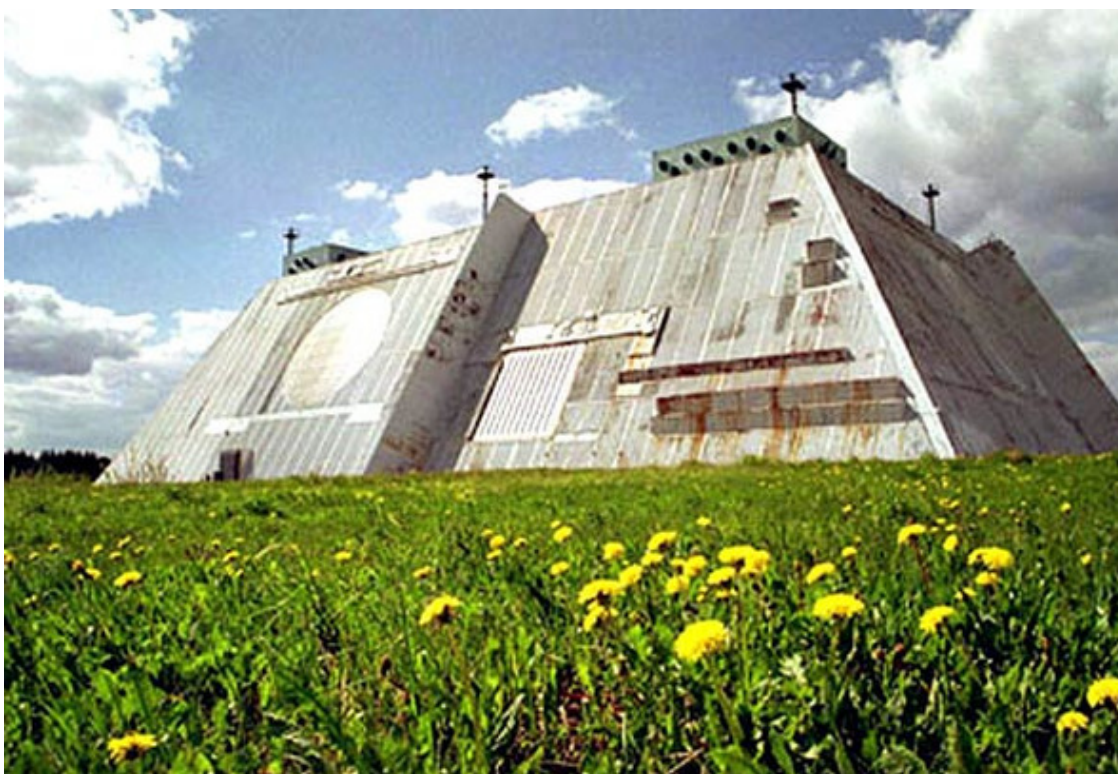
РЛС Дон в одуванчиках

И становились настоящими мастерами ПРО. Ввести весь полусектор в режим БР и посмотреть спутник на экранах КП стало обычным делом. А это фото сверху – история, правда грустная.