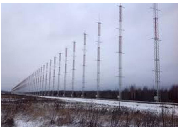
РЛС ЗГО типа Контейнер

Тогда на оборону денег не жалели. Как там говорится – не хочешь кормить свою армию, будешь кормить армию противника. Тогда этому правилу следовали очень строго. Вот такие времена, как говорит, известный в России, телеведущий. Пора, наверное, вернуться к этим временам. Ниже РЛС Дон бывшее технологическое здание приемного центра кубинского РТУ системы дальнего обнаружения системы ПРО. Здесь размещалась вся аппаратура приемного центра. Все развалено, разрушено. Грустно и обидно смотреть на все это. Особенно тем офи-