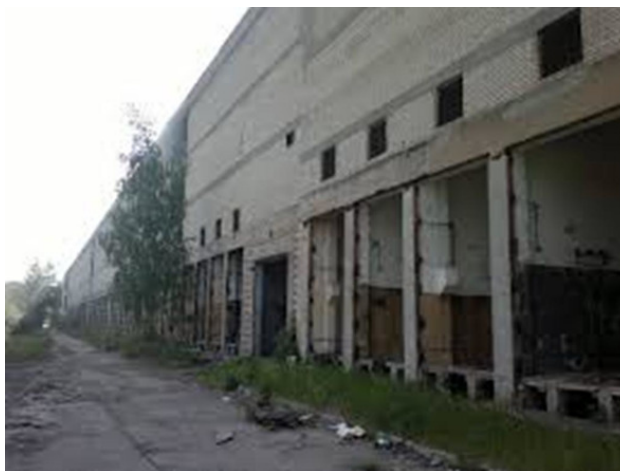
Остатки технологического здания РЛС типа Дуна 3М