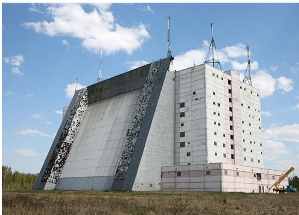
РЛС типа Волга

Американские ракетные базы, типа Ванденберг, эти станции просматривали до самых мельчайших подробностей. Ну и конечно, решали основную задачу – обнаружение стартов МБР с аналогичных ракетных баз. Чернобыльская РЛ станция попала в зону радиации после той ужасной трагедии и кто теперь выполняет эти задачи неизвестно. Наверное, все таки новые станции типа Воронеж. Они запущены в западной части Европы. Есть еще и на юге аналогичная станция. А вот на востоке кто решает задачи обнаружения ответить сейчас затрудняюсь. В наше время там действовала аналогичная станция ЗГО, но она, кажется выведена из строя.