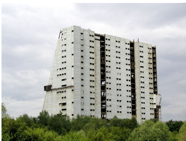
РЛС НГО типа Дарьял