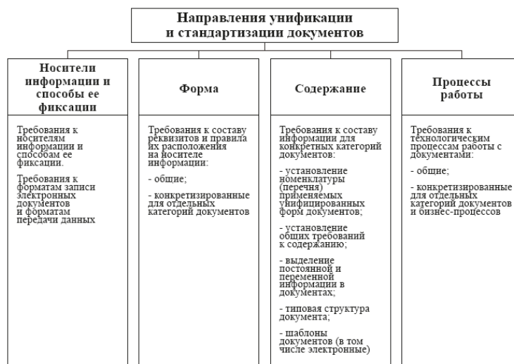
Рис. 3. Направления унификации и стандартизации документов

Можно выделить несколько основных направлений унификации и стандартизации управленческих документов как на бумажном носителе, так и электронных – это сами носители записи, способы фиксации информации, форма, содержание и технологические процессы работы с документами (рис. 3). В связи с расширением применения электронных документов в управлении требуется особое внимание к унификации носителей информации и способов ее фиксации, включая установление требований к форматам записи файлов документов, в том числе для задач их долговременного хранения, и форматам передачи данных.