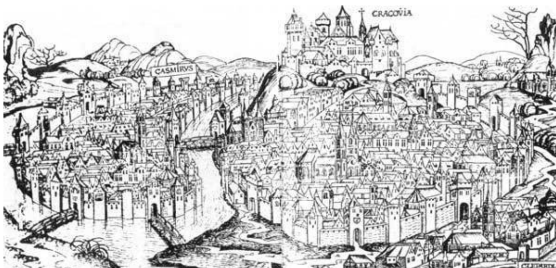
Вид Кракова конца XV века – «Хроника» Шеделя.