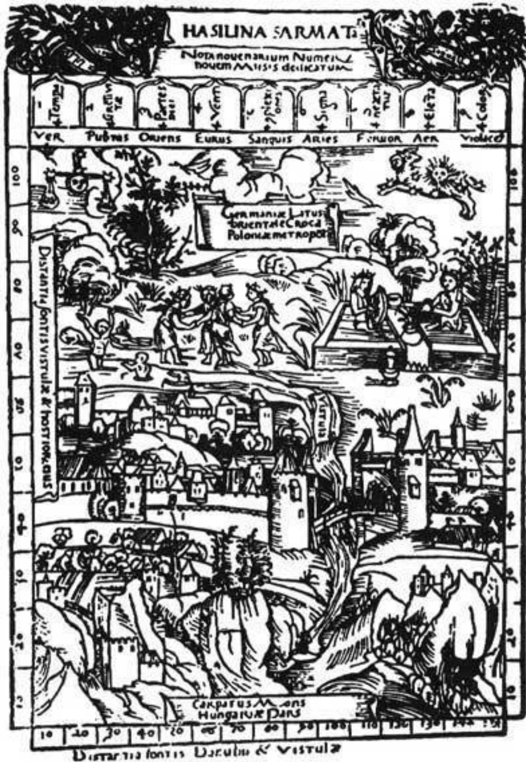
Краков в конце XV века. Гравюра Г. Зюсса из книги Конрада Цельтиса «Quattuor libri amorum», Нюрнберг, 1502.

Краковский университет, основанный в 1400 году Владиславом Ягеллоном, пользовался в то время большой известностью. Сюда приезжали учиться из Богемии, Германии, Швеции, даже из Италии, своей культурой превосходившей остальные европейские государства.