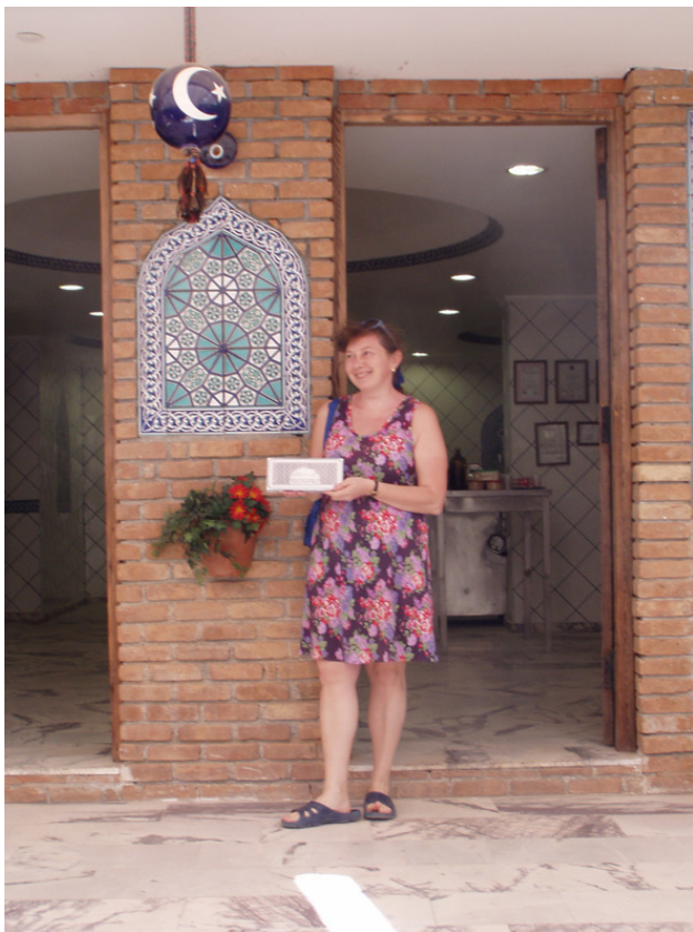
На фабрике по изготовлению лукума.