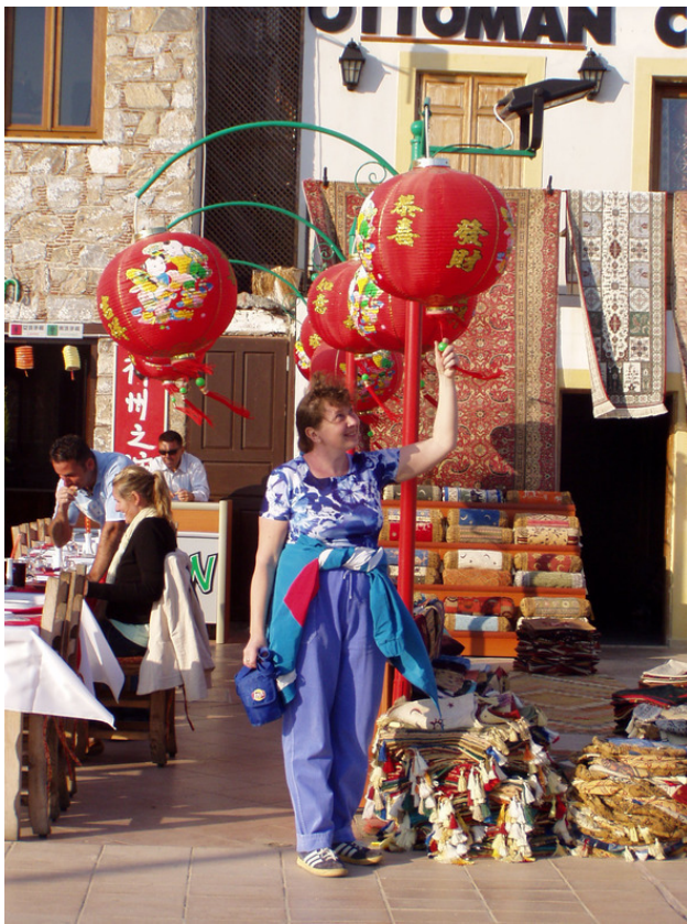
На набережной Мармариса.