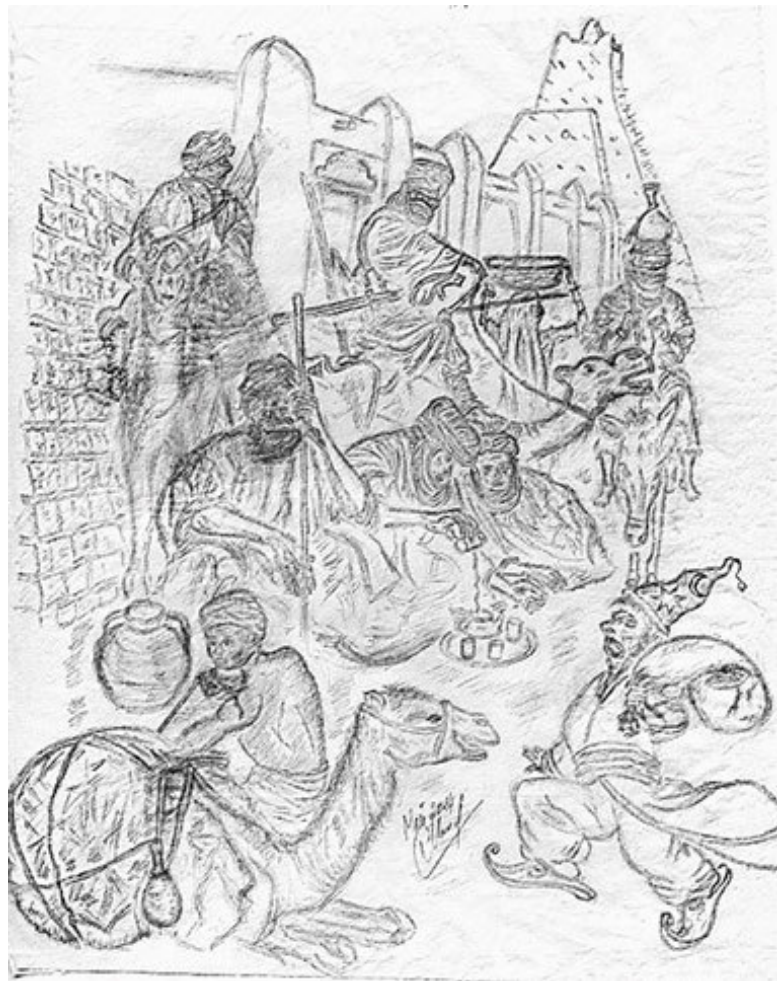
Караван Аль-Мажнуна на улицах Тимбукту.