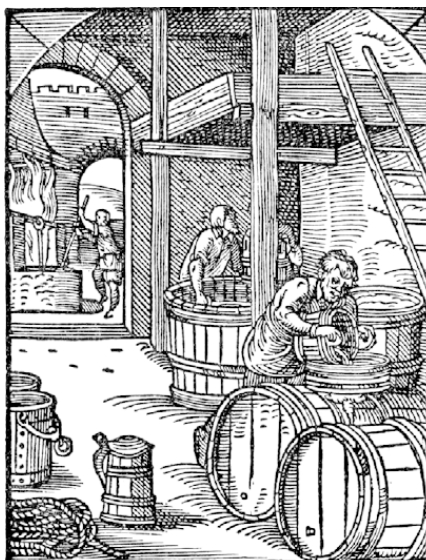
Рис. 0.1. Интерьер немецкой пивоварни XVI века из книги Йоста Аманна Ständebuch (1568 год)

В Германии пивоварен больше, чем в любой другой европейской стране, причем 730 из 1280 находятся именно в Баварии.