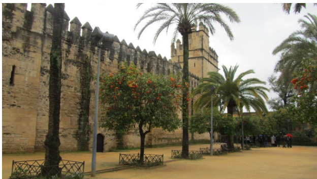
Стены средневековой Кордобы

р. Хасдай в начале своего письма говорит, что до него дошли слухи о существовании еврейского царства и он хочет узнать, правда ли это, т.к. его интересует судьба еврейских собратьев в разных странах. Он пишет о географических координатах Андалузии, о расстоянии от столицы до Средиземного моря и до Хазарии. И тут нам предстоит поломать голову.