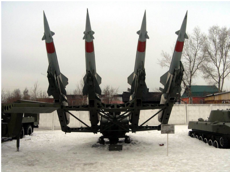
ЗРК С – 125 НЕВА

Прекрасно показала себя наша армия и в боевых условиях. Отлично работала наша авиация в Корее. Блестяще себя показали наши ЗРК во Вьетнаме, Ближнем Востоке. Много славных страниц в историю нашей армии вписали ВДВ, ВМФ. Казалось мирную, но сложнейшую задачу, выполняли наши химические подразделения по ликвидации аварии