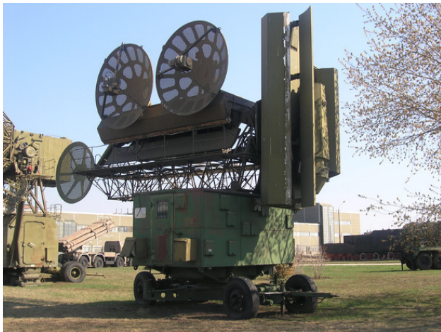
ЗРК С – 75

Я же знал зенитно ракетные войска, что наряду с радиотехническими войсками и авиацией ПВО входили в очень серьезный вид Вооруженных Сил – Войска ПВО страны. Позднее для меня были уже другие войска. Новые и передовые. Войска ПРО, ПРН. Но начало было в ЗРВ. Заканчивал я училище именно по этому профилю. ЖКВУ – Житомирское Краснознаменное Военное Училище. Училище весьма известное и престижное. Учились мы три года. Потом, в дальнейшем, родное училище поменяло профиль и срок обуче-