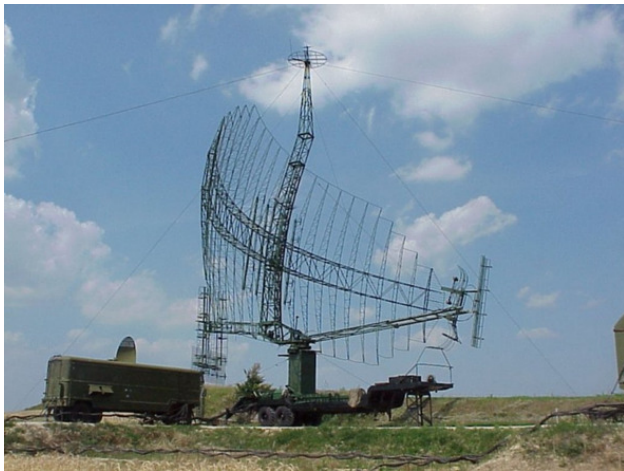
РЛС П – 14

И уж если мы коснулись войск ПВО страны, и в частности ЗР войск, то хочется вспомнить и истинных трудяг этих войск – радио технические войска. Вот уж истинно зоркое око наших воздушных рубежей и просторов. Они всегда на страже нашего неба. Готовность у них всегда постоянная. Они, их расчеты, всегда на боевом дежурстве. Проводки целей, слежения, обнаружения, литерные самолеты – вот некоторые слагаемые их повседневной работы. Они, эти трудяги, должны первыми обнаружить воздушные цели на дальних