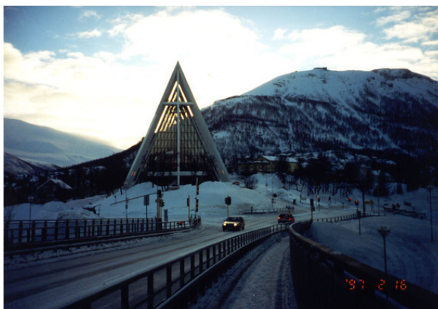
Церковь на материковой части Тромсё. 16 февраля 1997 г.