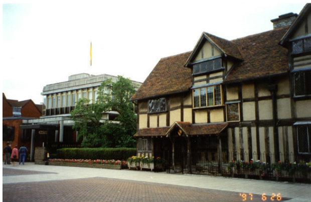
Дом Шекспира в Стратфорде. 26 июня 1997 г.