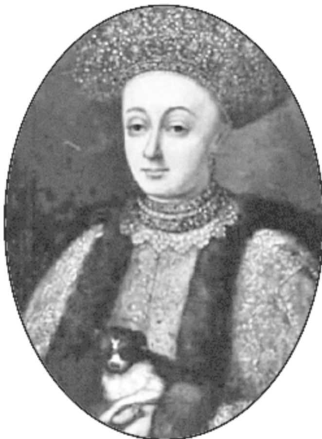
Царица Марфа Матвеевна Апраксина

Символично, что в свой последний путь доктор, всю жизнь метавшийся от одной христианской конфессии к другой, ушел как иудей. Вот что рассказывает об этом очевидец: «Я приехал в Москву через три или четыре дня после погрома [в Кремле. – Л. Б.] и пошел на похороны с другими анусим [крещеными евреями. —Л. Б.], что был дан от царя приказ похоронить убитых. Даниил был изрублен на куски: отрублены были одна нога и одна рука, тело проколото копьем, а голова разрезана топором. Я и другие анусим похоронили Даниила и его сына... в поле».