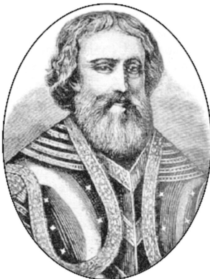
А. С. Матвеев

Досталось тогда всем людям, близким к Матвееву. Не миновала злая судьба и его друга и соратника Даниила фон Гадена. Даниилом именовали царского придворного доктора Стефана фон Гадена, или, как его еще величали на русский манер, Даниил Жидовин или Степан Фунгаданов. Этнический еврей, служивший русскому царю с 1656 года, он постепенно сделался самым популярным врачом в Москве. При Федоре Алексеевиче ему было доверено «ходить только к хоромам – к благоверной государыне царице и великой княгине Наталье Кирилловне и благоверным государям цесаревичам и к благоверным государыням цесаревнам – к большим и меньшим».