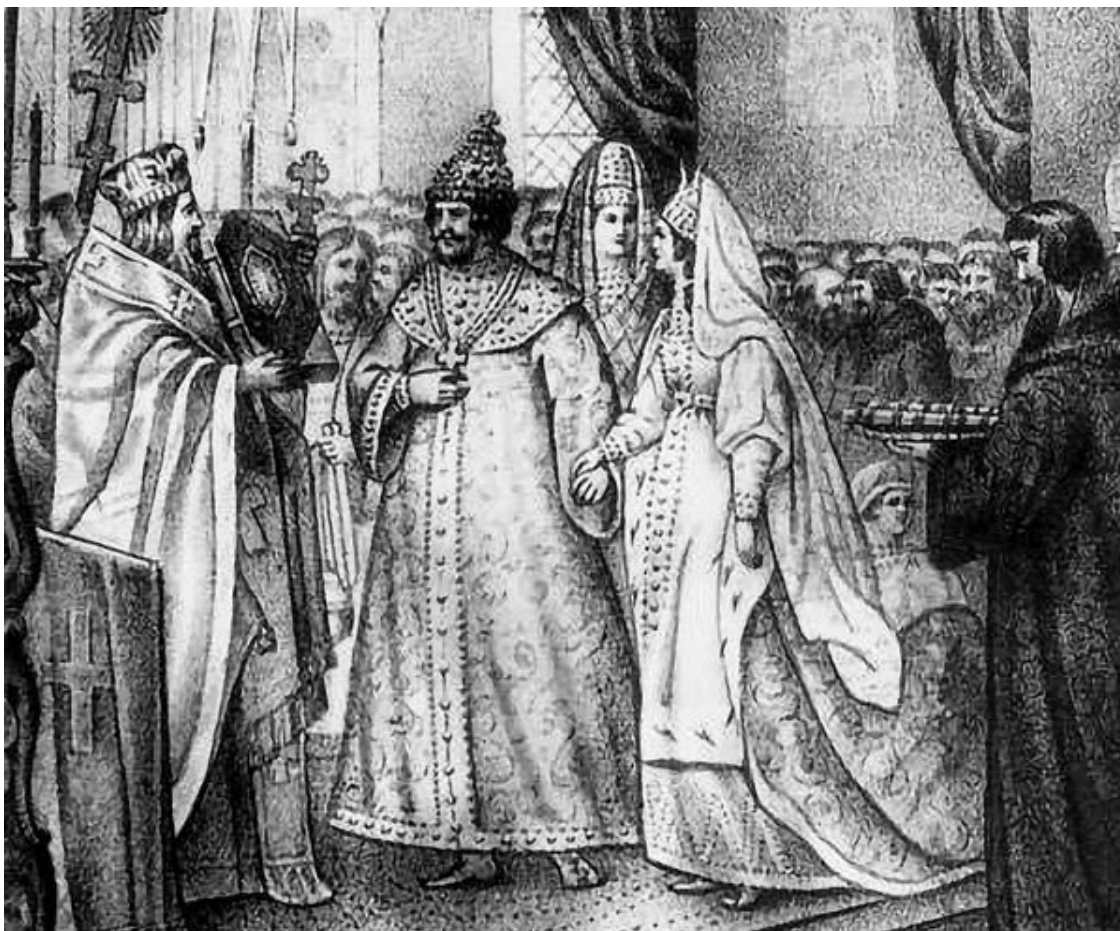
Венчание Ивана III с Софьей Палеолог в 1472 г. Гравюра XIX в.