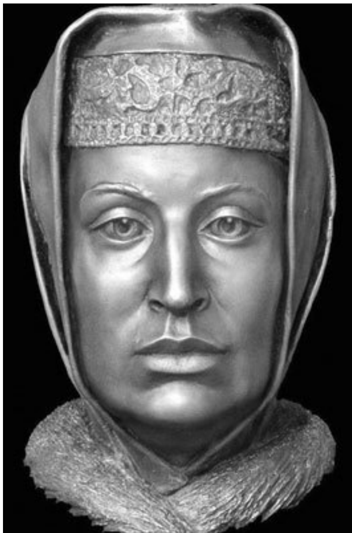
Софья Полеолог. Реконструкция

Несомненно, молодой медик сам стал жертвой заговора, орудием изощренного убийства, и на него, еврея, списали гибель российского наследника. Не подозревая того, что Иван мог быть злодейски отравлен, Леон лечил его именно от «камчуги» (подагры), от которой, как он знал, не умирают. Потому-то не было в его словах никакого самохвальства, когда он ручался Ивану III за жизнь и исцеление его сына. К тому, чтобы диагноз Леона оказался неверным, приложила руку все та же Софья, сделавшая все, чтобы врач, не подозревавший о возможности отравления, не разобрался в ситуации. Сам факт, что эскулап был привезен из-за границы, говорит о том, что Ивана отравили чем-то местным, специфическим, не знакомым Леону, тем, что в Италии не растет и не ползает. Единственно, на что можно посетовать, – это, что медик не посоветовался с местными русскими знахарями и ворожеями (уж они-то могли подсказать противоядие!), но те «медицинских академиев» не кончали, а потому вряд ли пользовались при дворе каким-то весом. Да и при языковом и культурном барьере между ними и Леоном такое было тогда едва ли мыслимым.