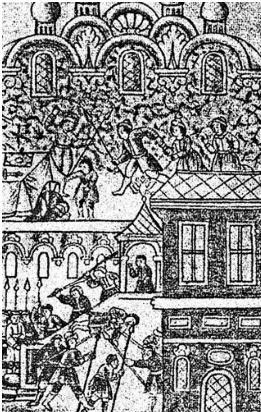
Стрелецкий бунт 15 мая 1682 года. Миниатюра XVIII века

Впрочем, его дорога к успеху была неровной и извилистой. Он определяется врачом к великому польскому гетману Николаю Потоцкому, но армия поляков терпит поражение, и Даниил попадает в татарский плен в Крыму. Там его продают в рабство османам в Константинополь, откуда он бежит с помощью одного еврейского купца. Минуя Валахию, он оказывается в Каменец-Подольском, где лечит поляков, сражавшихся с казаками под водительством сына гетмана Богдана Хмельницкого, Тимофея. Жительствовав некоторое время в городах Дрожиполе, Шаргороде и Сатанове (где он, между прочим, женился), Гаден, наконец, решает поселиться в живописном Черткове, близ Тернополя, где также практикует медицину. Там-то и настигли его в 1656 году русские, взявшие Чертков штурмом. Даниил попадает в Киев, в полк воеводы В. В. Бутурлина, и столь же ревностно, как он лечил поляков, врачует украинцев и