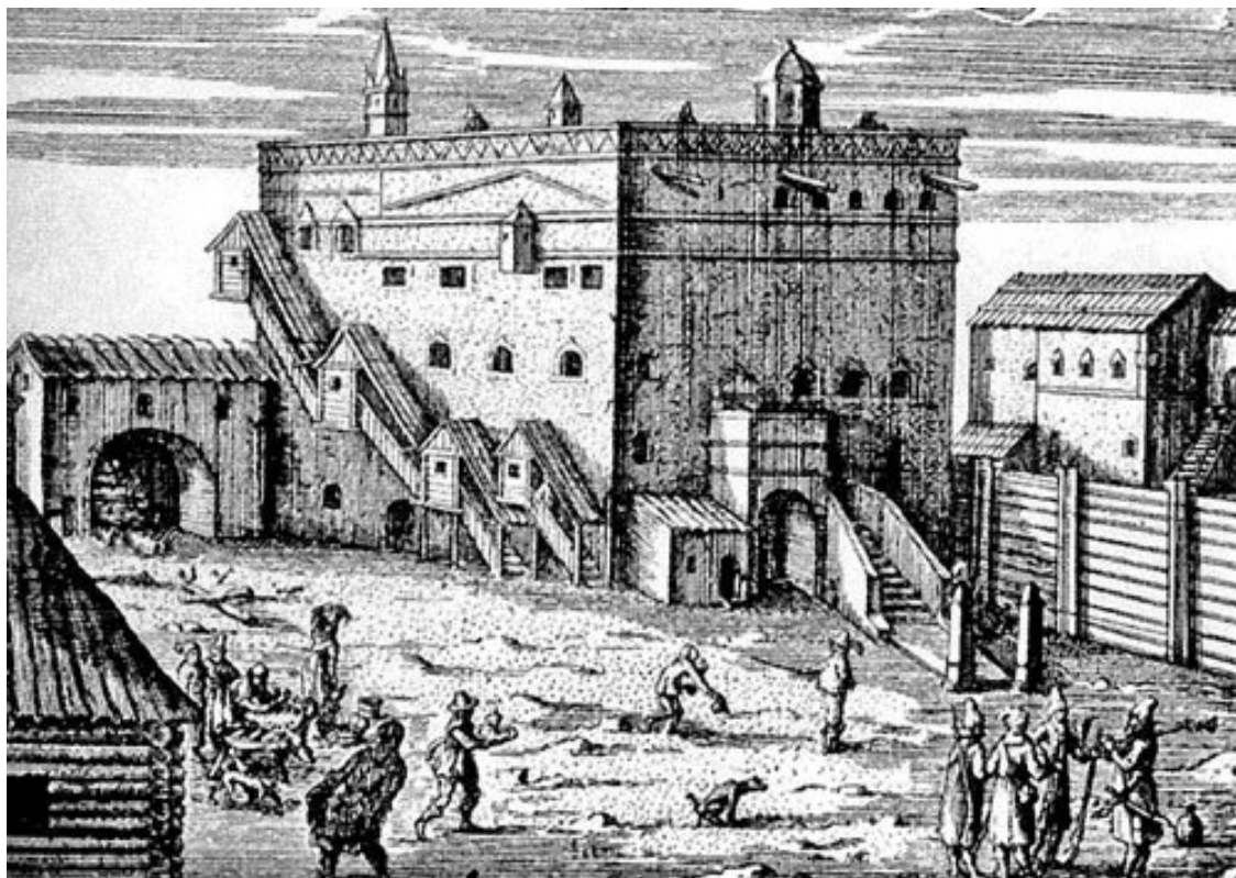
Посольский двор в Москве. XVII век