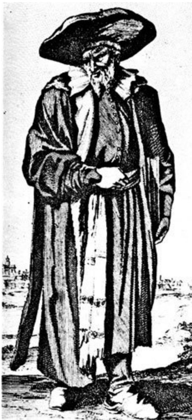
Польский еврей. XVIII век

Досужие толки «супротивников» по сему поводу воссозданы в III части трилогии Д. С. Мережковского «Антихрист (Петр и Алексей)»: