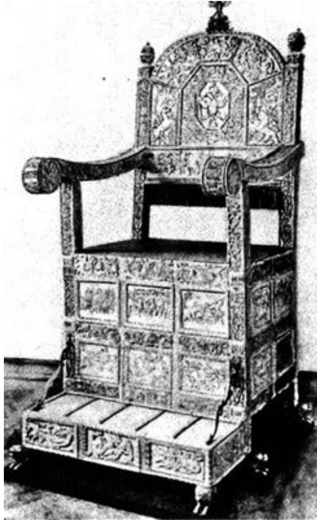
Тронное кресло московских государей XV – XVI веков