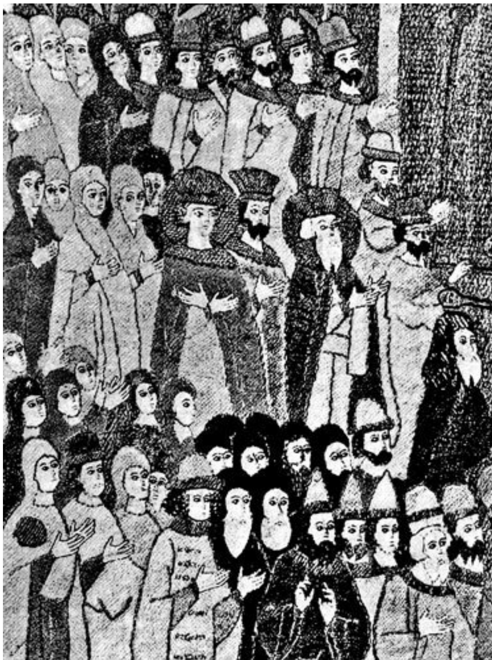
Изображение семьи Ивана III на шитой пелене того времени

В пользу версии о непосредственной причастности Софьи Палеолог к устранению претендента на русский трон говорит и логика ее поведения по отношению к сыну Ивана Молодого, Дмитрию, который после смерти отца официально был объявлен наследником престола. По наущению Софьи его также пытались отравить. По счастью, это не удалось: меры безопасности в Кремле были тогда усилены, и знахарки, доставлявшие яды Софье, были схвачены и утоплены в Москве-реке. Но что не смог сделать яд – сделала ловкая византийская интриганка. В одночасье Дмитрий со своей матерью Еленой Волошанкой оказались в тюрьме, а сын византийки, Василий, вдруг стал соправителем отца и наследником престола.