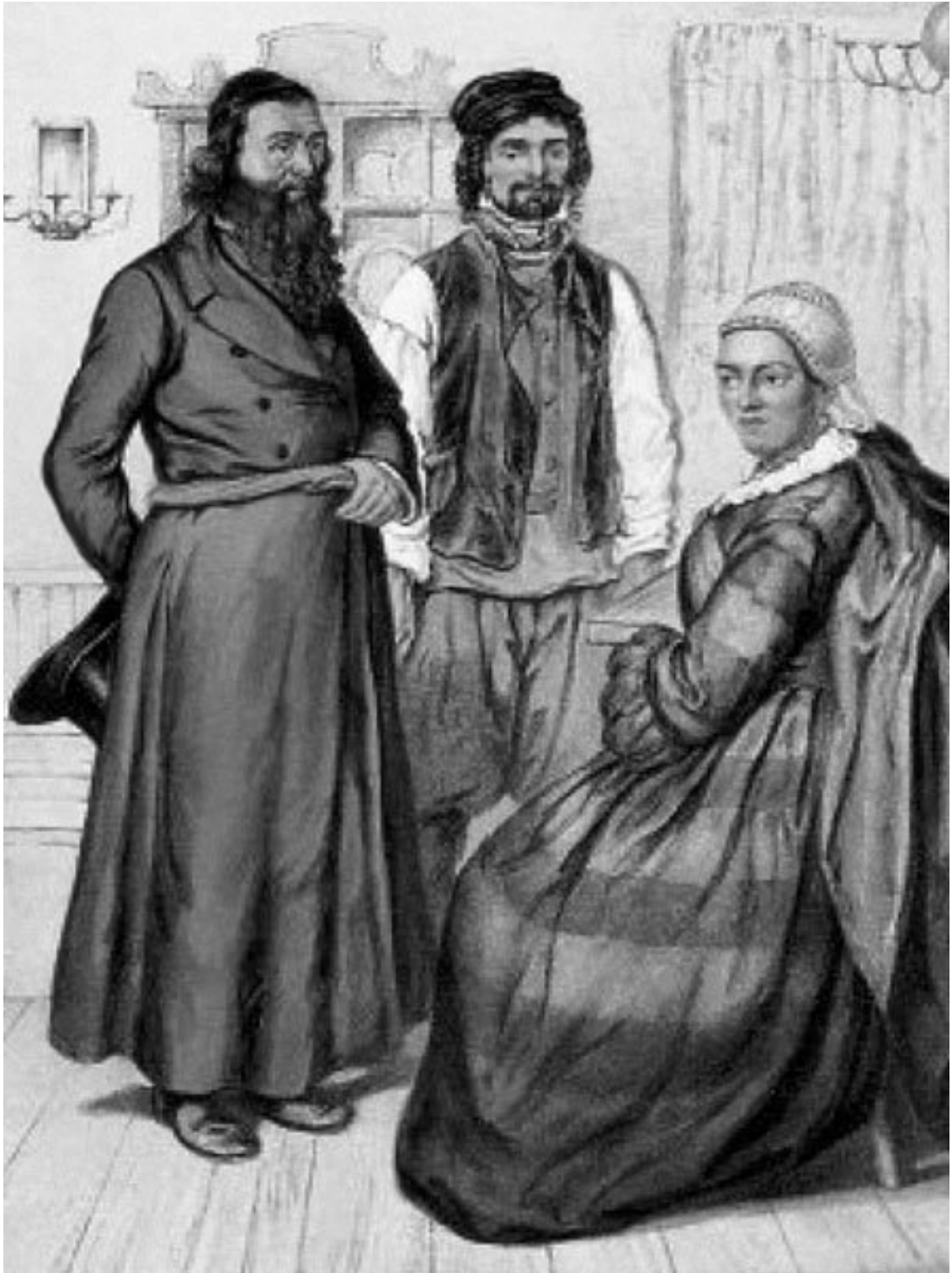
Евреи. Из книги Густава-Теодора Паули «Этнографическое описание народов России» (Спб., 1862)