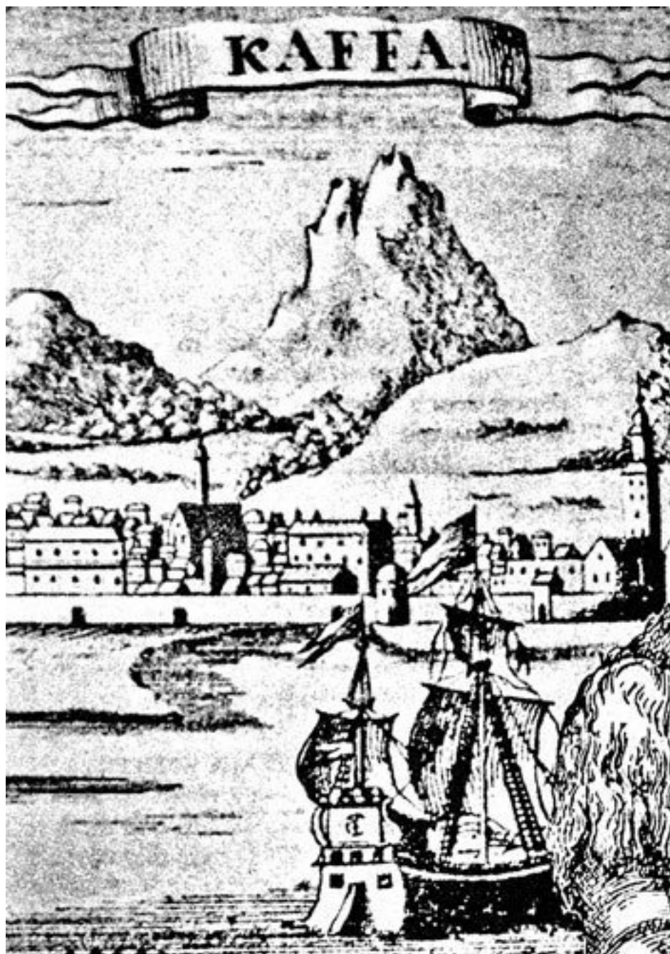
Вид г. Каффы (Феодосия)

Впрочем, Кокос оказывал услуги Менгли-Гирею еще до того, как тот занял престол крымского хана. Он как будто предугадал желание царя – заполучить этого надежного союзника на рубежах с Казанью, Ордой, Польшей и Литвой, понимая, что союз с Крымом, а через него и с султаном турецким, был жизненно необходим Москве: ведь ослабление распрей на сем пограничье решало важнейшую для Московии задачу о вольнице Новгородской. Когда встал вопрос о ханстве в Крыму, Кокос послал Ивану III своего зятя Исупа с ходатайством о помощи Менгли-Гирею со стороны Руси и получил требуемую от русского самодержца сумму.