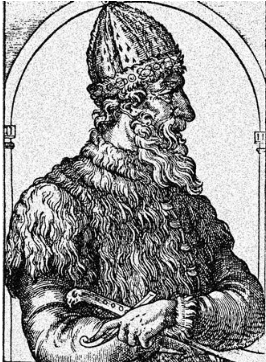
Иван III Васильевич