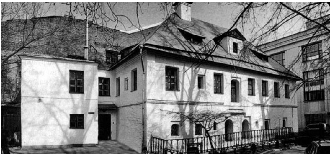
Здание Аптекарского приказа