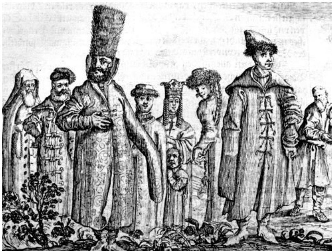
Московиты в XV веке