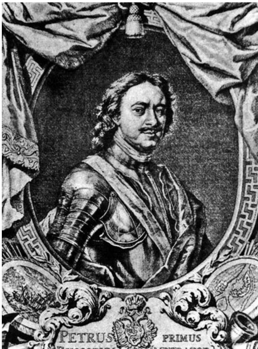
Император Петр I