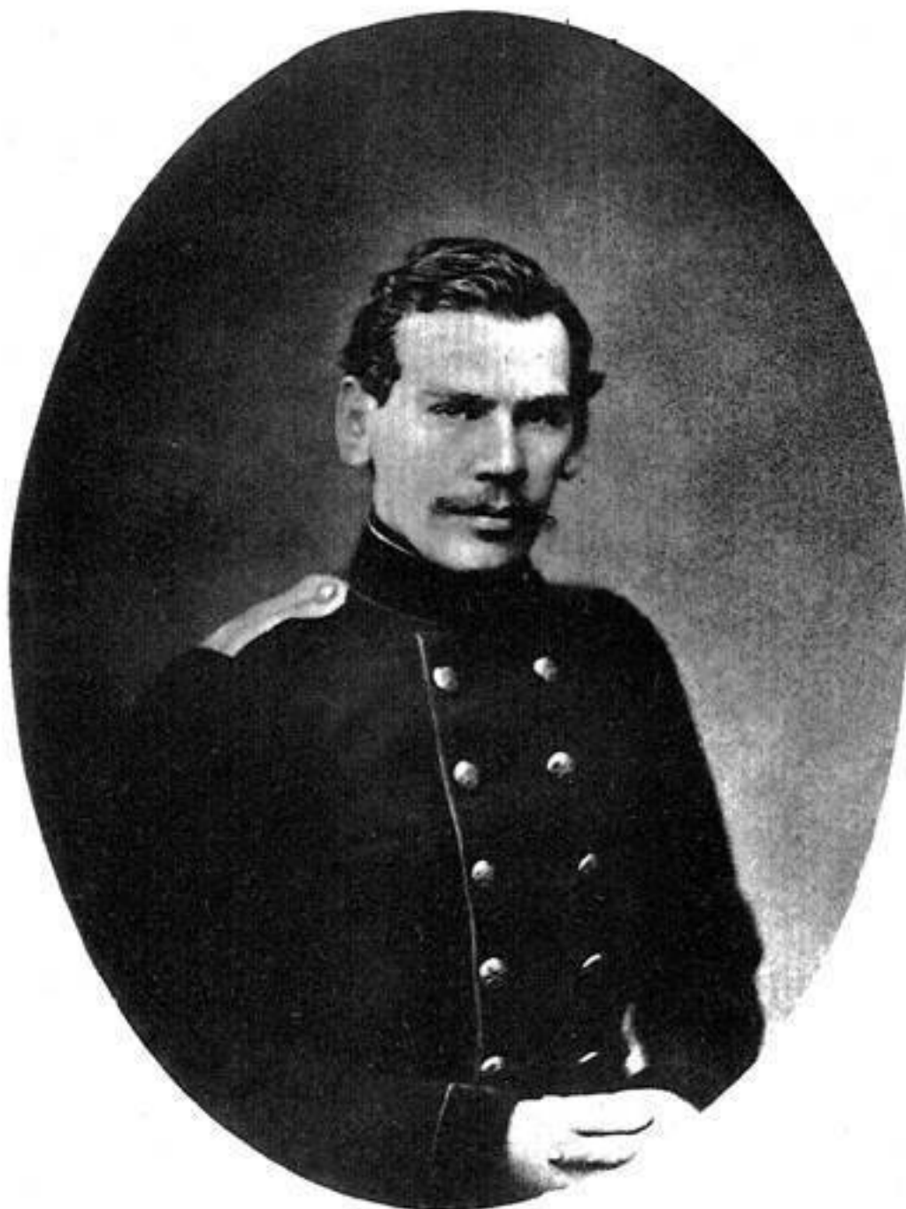
Л. Н. ТОЛСТОЙ 1856 г. Размер подлинника