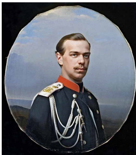
Великий князь Александр Александрович (будущий Александр III).