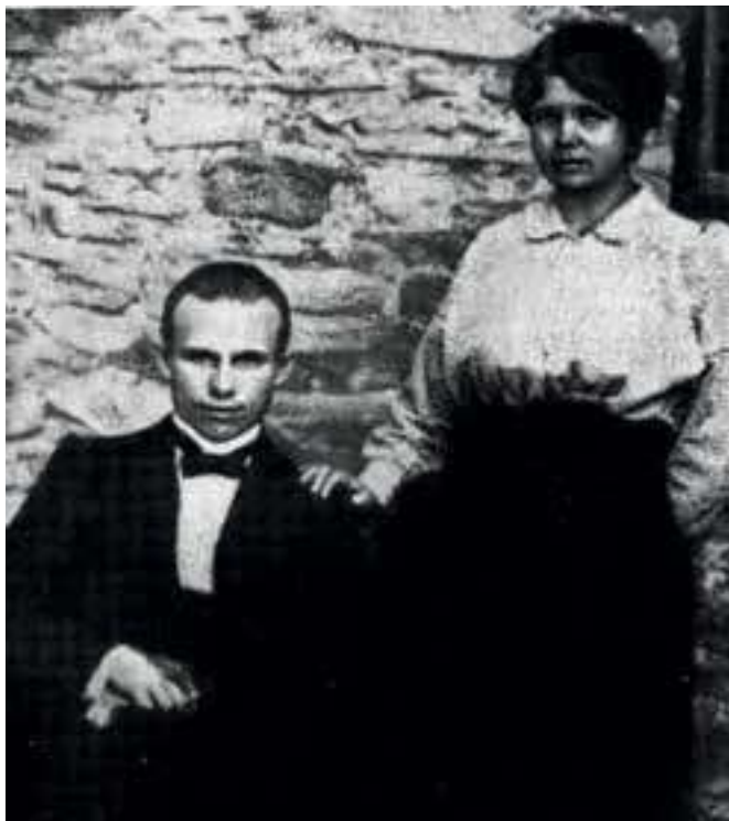
Хрущёв с женой Ефросиньей. Юзовка. 1916 г.

шел в слесари, стал прилично зарабатывать. Купил себе фотоаппарат, часы и велосипед – вещи по тем временам статусные, особенно в рабочей среде. В 1914 году началась Первая мировая война, но Хрущёва как высококвалифицированного рабочего освободили от призыва в армию.