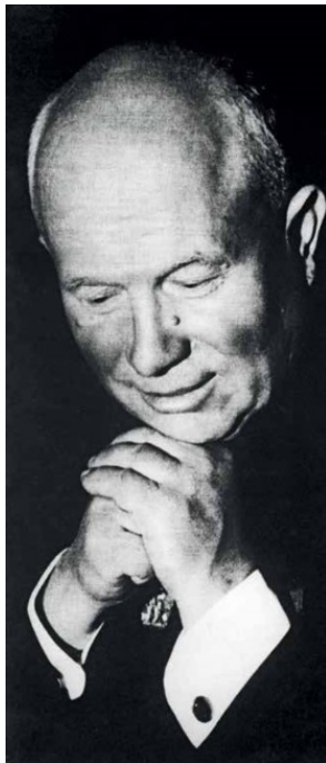
Н. С. Хрущев.