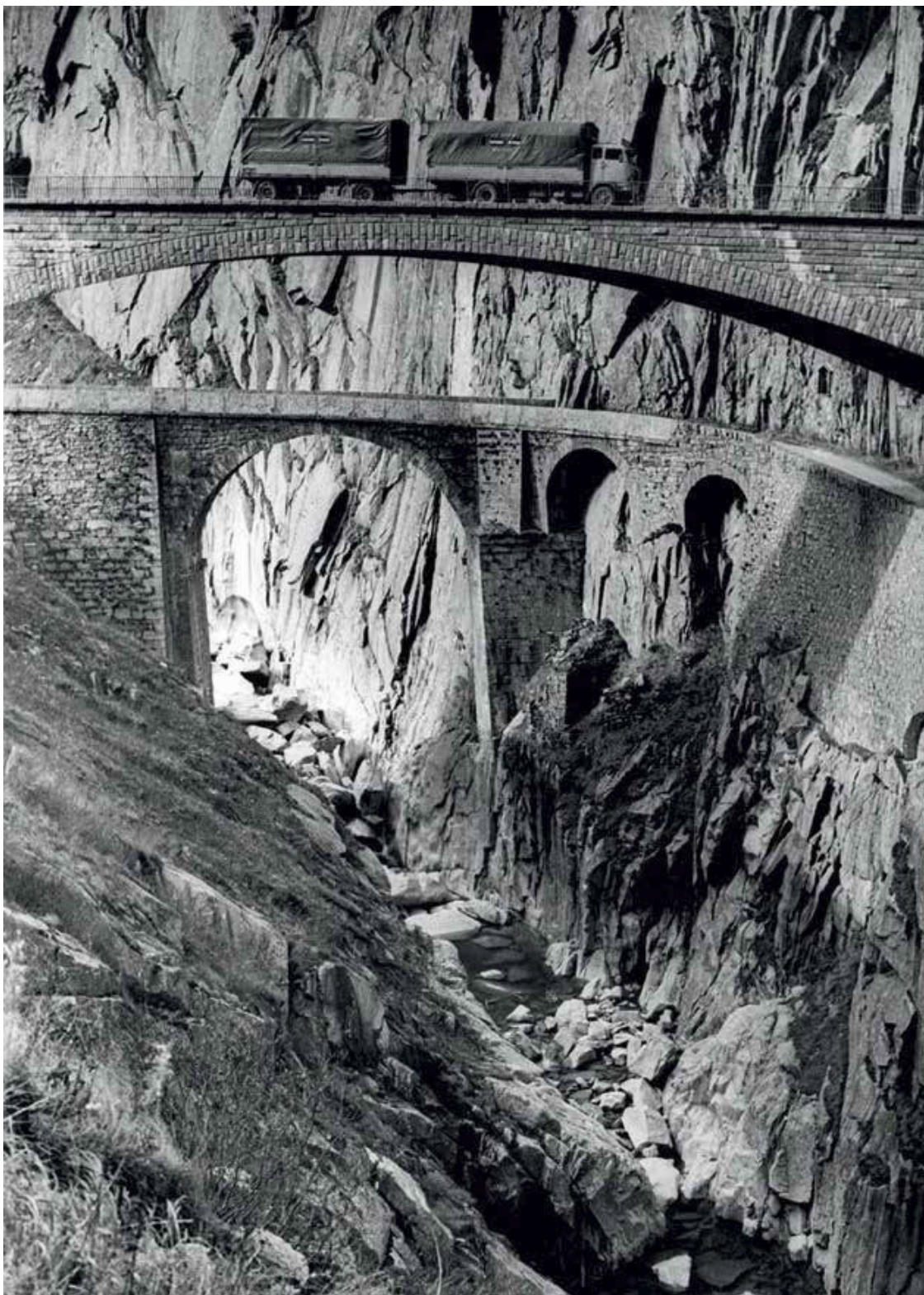
Чертов мост. Сегодня тут действуют два моста.