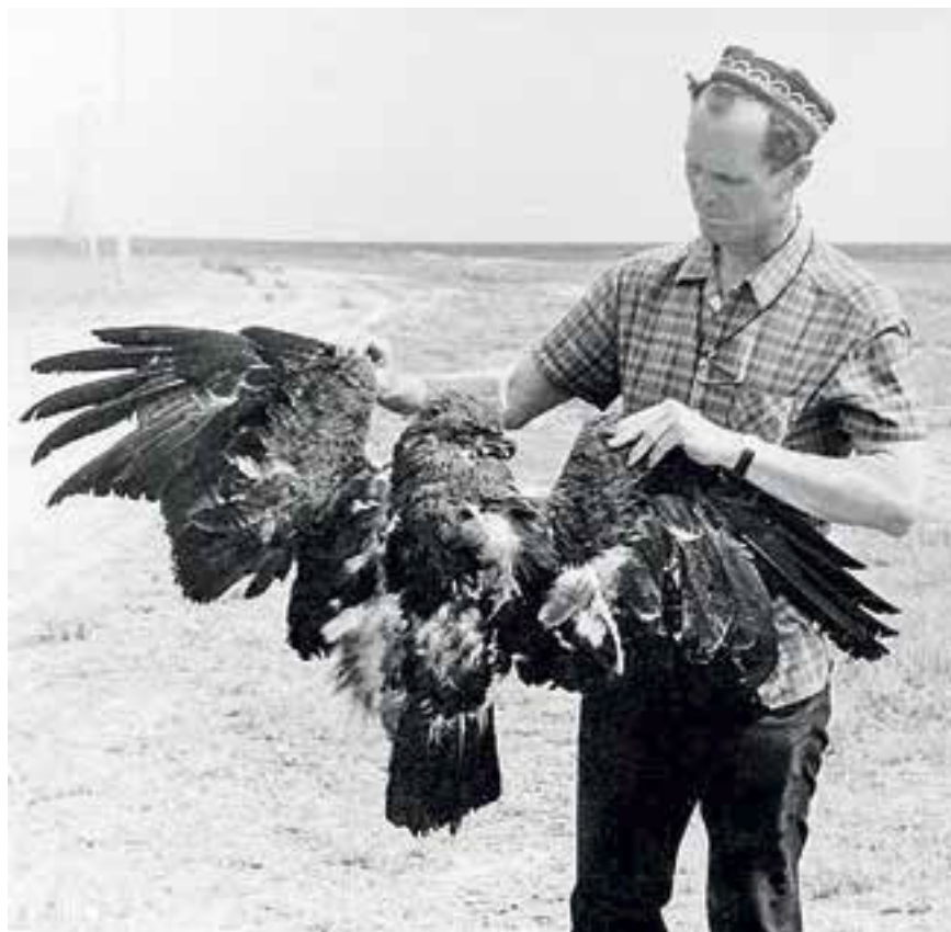
Удар током убил красавца, севшего на провода...