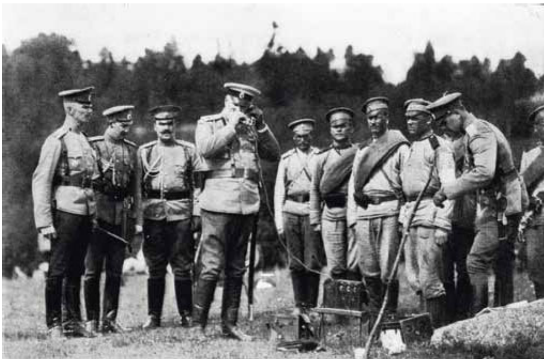
Полевой штаб. Офицеры на связи с командованием.

Именно после Лодзинской битвы Павел Адамович заслужил славу мастера кризисных ситуаций, о котором вспоминают в тяжелой оперативной обстановке. Директивы генерала пронизаны требованиями «держат связь», «энергично атаковать», «активно применять конницу», «энергично наступать», «действовать самым решительным образом». Именно его действиям Лодзь обязана спасением, а ударная группа немцев – котлом. Плеве прекрасно понимал: только нерешительность, неумение ориентироваться в быстро меняющейся обстановке современной войны, невладение ситуацией со стороны командования фронта не позволили тактическому успеху перерасти в оперативный, а возможно, и в стратегический.