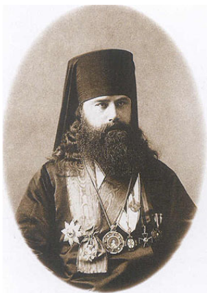
Архиепископ Иннокентий (Беляев)

В 1903 году проходили торжества при открытии святых мощей преподобного Серафима Саровского в присутствии Государя Николая II, Императрицы и Их Высочеств.