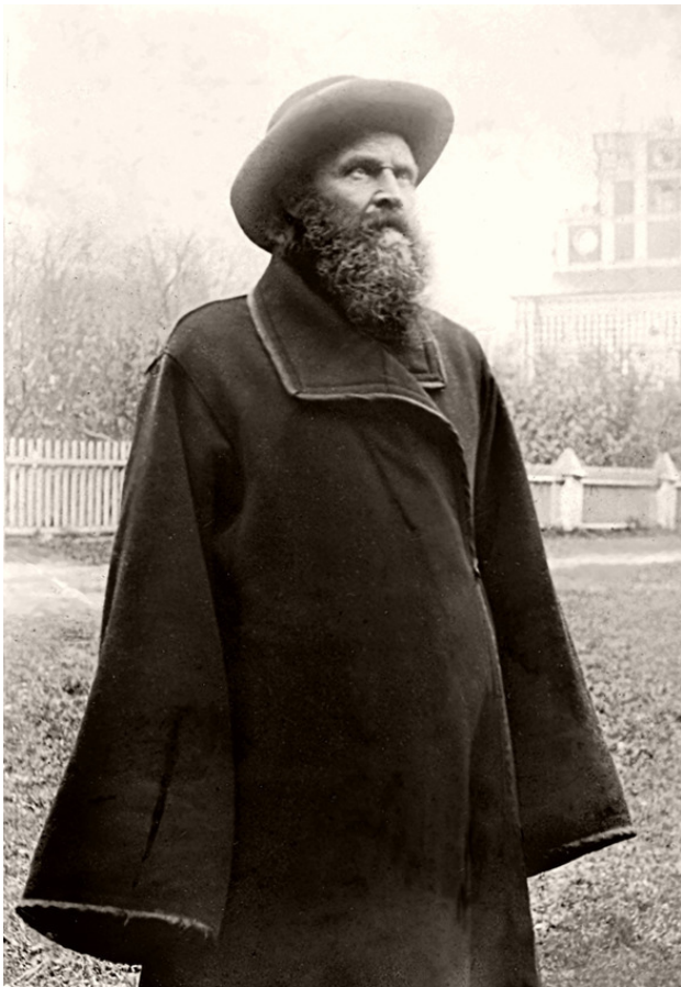
о. Константин (Снятиновский)

Однажды Шура меня спросила: «Знаешь ли ты, что здесь вся земля насыпная?» Я об этом даже не догадывалась, по-