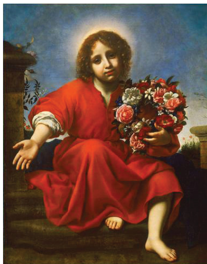
Карло Дольчи – «Юный Христос с букетом цветов»