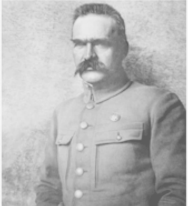
Юзеф Пилсудский. Грабитель, японский агент.