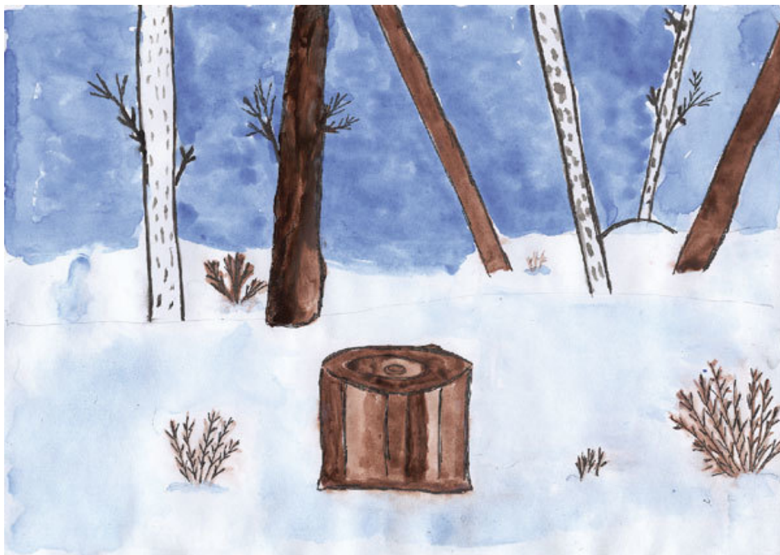
Обарухина Настя. Зимний лес. 348 shk. 3 kl.