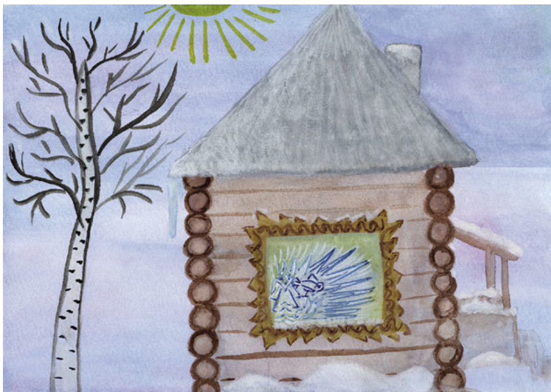
Казиминова Ульяна. Узоры на стекле. 700 шк. 4 кл.