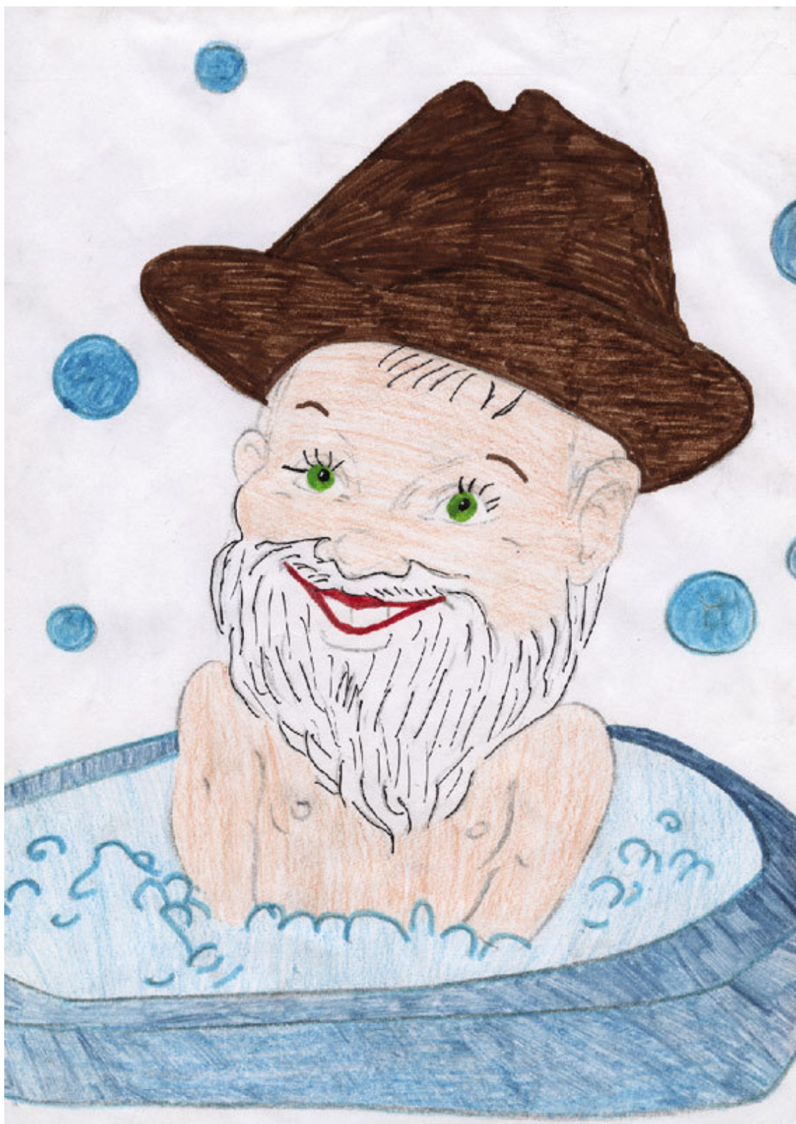
Королева Даша. Вылитый дедушка. 569 шк. 3 кл.