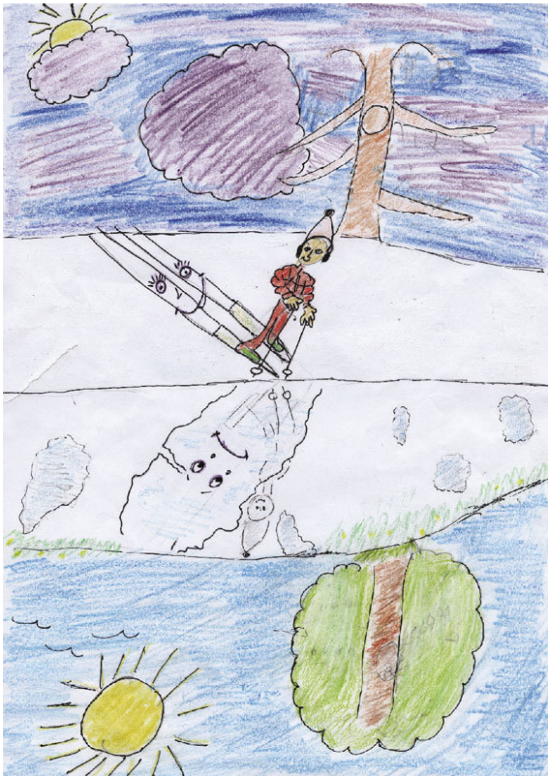
Шишкова Диана. Лыжня. 574 шк. 4 кл.