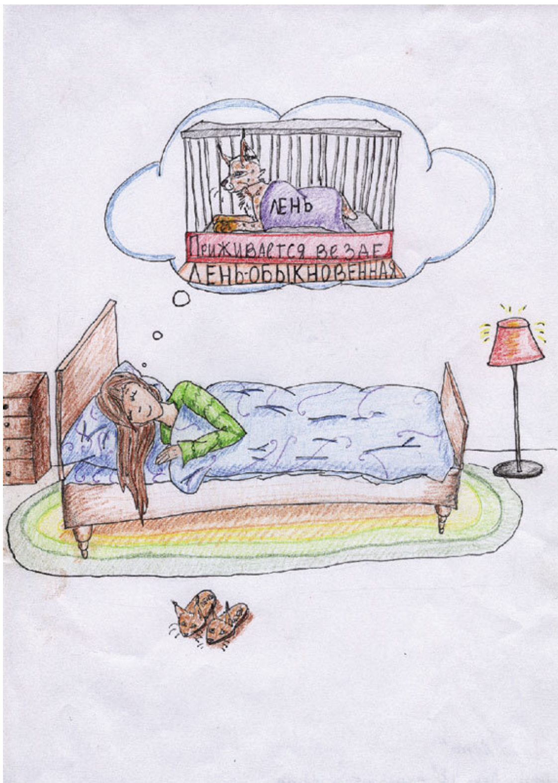
Достова Лена. Лень. 569 шк. 4 кл.