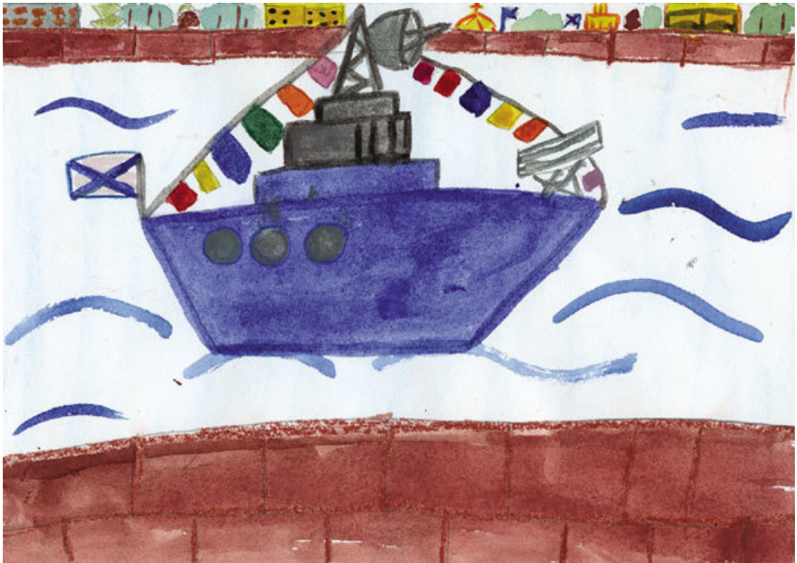
Степанова Лиза. На Неве, д/с 14, 7 лет

Корабли на невском рейде. Многоцветье в синеве; Флаги праздничные, рейте На красавице Неве!