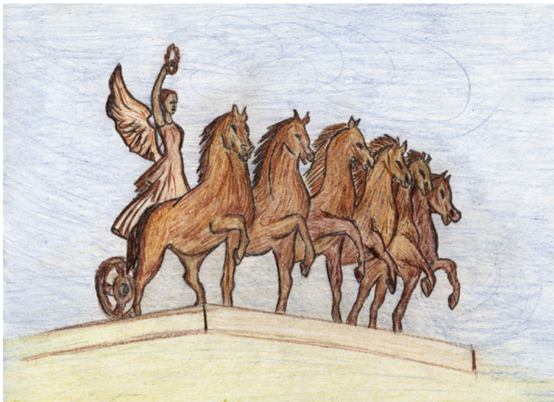
Буровихин Алеша. Фотография. 222 shk. 2 kl.