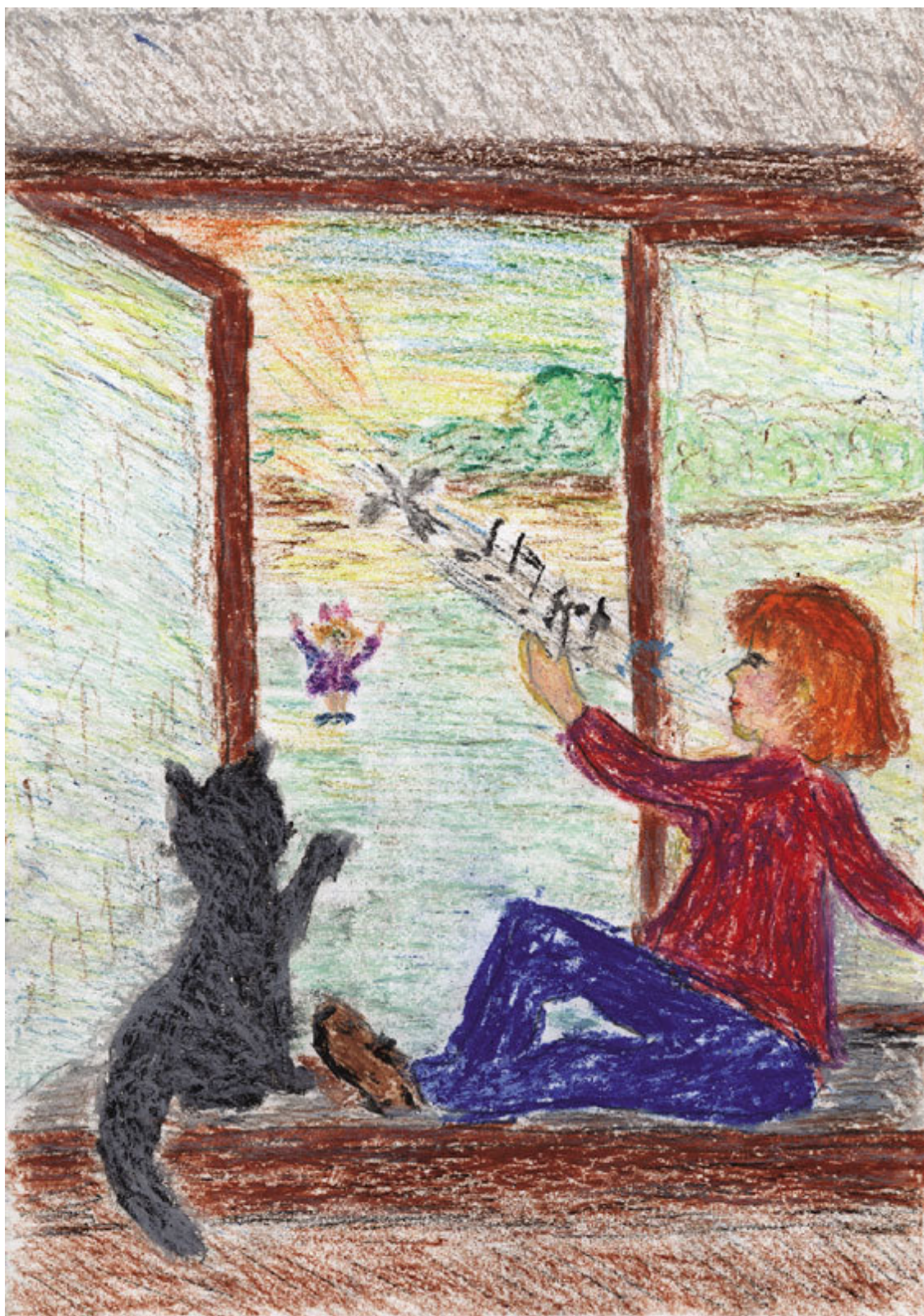
Добров Даниил. Песенка. 348 shk. 1 кл.