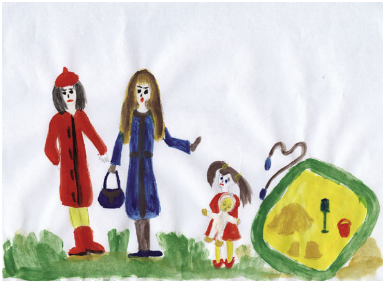
Скрипина Маша. Заморочка, д/с 126, 7 лет