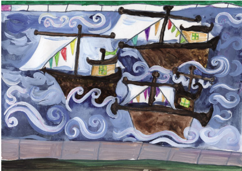
Макаров Даниил. Парад на Неве. 557 shk. 4 kl.