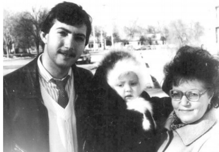
С мамой и дочкой