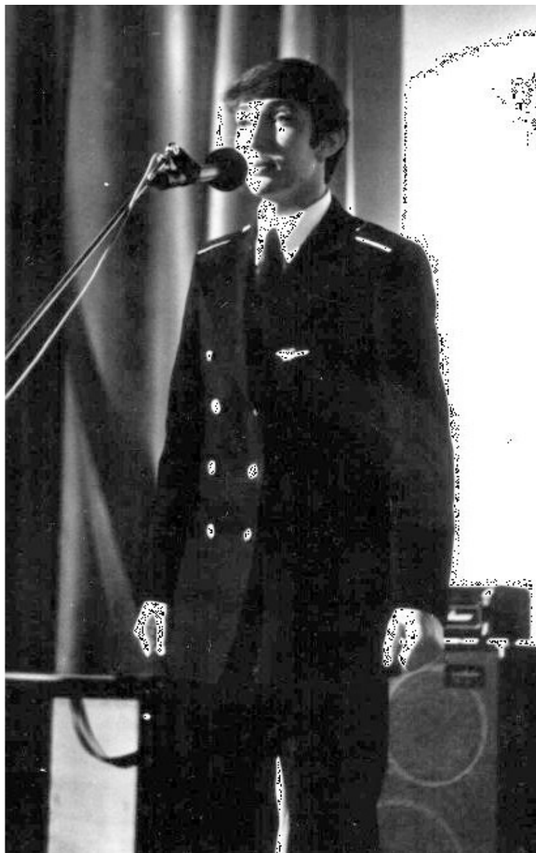
Поэтический вечер в Академии ГА