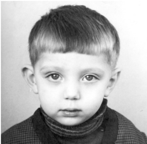
Автор в детстве