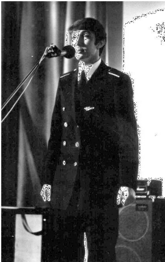
Поэтический вечер в Академии ГА