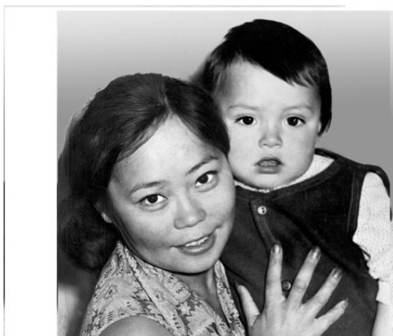
!1973 год. Мы с сыночком