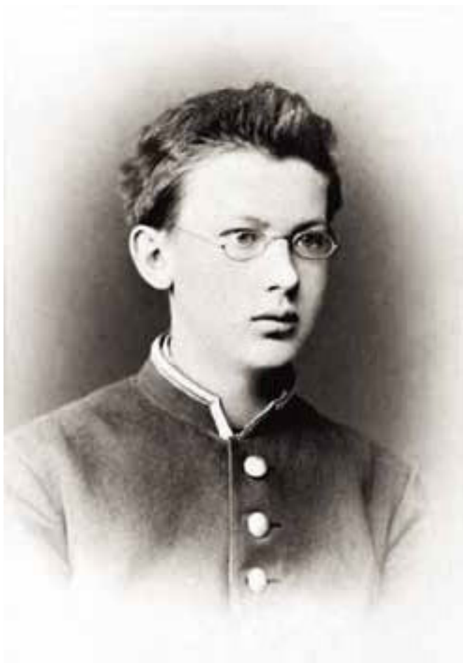
Володя Вернадский, гимназист 1-й Петербургской гимназии, 1878 год.