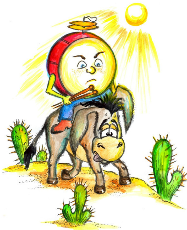
Бар с ослом среди кактусов

Ослom он обзавелся совершенно случайно и, к тому же, против своей воли. А началось всё с тарелок. Видите ли, дело в том, что тарелки на голове у Бара, также против его воли, бились одна о другую и постоянно дребезжали. А в пустыне, по которой ехал Бар, жили ужасно нервные бандиты. До того момента, как его остановили, он был счастливым обладателем красного автомобильчика на упругих шинах и тихонько насвистывал песенку: «Ох, вы палочки ударные, барабанные мои!». Его тарелки весело позванивали, что довело одного из бандитов до белого каления. Этот бандит устроился у огромного валуна рядом с дорогой, собираясь вздремнуть после утомительного ночного погрома. Но только он сомкнул глаза, как вдруг – нате вам – дребезг! Он выскочил из-за валуна, точно ошпаренный петух, и бросился на автомобильчик с таким воплем, как будто машины уже давно сидели у него в печенках. Бар приготовился защищаться. Но он слишком долго раздумывал: оглушить ли противника барабанным боем или попросту использовать кулаки. Когда он, наконец, решил в пользу барабанного боя, то обнаружил, что катится по песку в неопределенном направлении, а разбойник усердно ломает его автомобильчик.