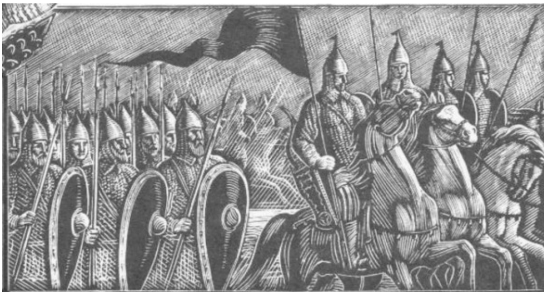
«Слово о полку Игореве», иллюстрация В. Фаворского

Встретившись «на слиянии», как говорят местные жители, князья начали углубляться в степь, в сторону Дона. Пошли на юг, переходя от одной излучины Донца к другой. Русло реки, правда, в те времена имело несколько иной от привычного нам сегодня рисунок. Но пойдём, вслед за игоревой дружиной и мы.