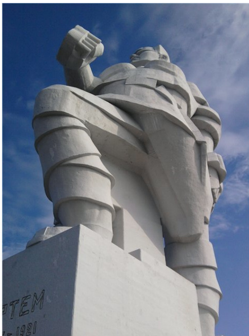
Артем, монумент работы Ивана Кавалеридзе, 1928 г.