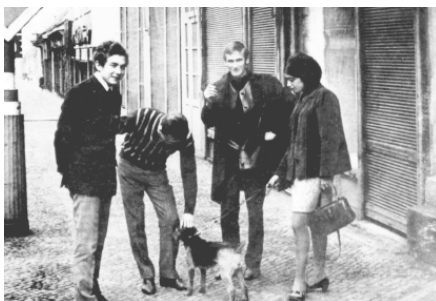
Школьные годы. Леня с мамой

В газете я понял, что самые бескорыстные люди – это, конечно, провинциальные газетчики, и особенно южные. Там одна ковбоекка, одни сандалии чудовищного канареечного цвета – и остальное неважно, человек шлепает в этом года три-четыре. Поэтому любые малые деньги, 20–30 рублей за какую-то публикацию, за подборку стихов, тратились на пиво с друзьями. Я не видел, чтобы кто-то особо пьянствовал из газетчиков. Пили пиво... Жара чудовищная. К пиву – либо подсоленный горошек, либо еще какая-нибудь ерунда, либо горячие манты. И пиво, пиво, пиво... Вот за пивом бесконечные разговоры только о поэзии, о кино, о том, что в Москве. Бесконечные прожекты. Кто-то пишет повесть, кто-то пишет рассказ. Этот рассказ не пропустили, и так далее... Собственно, воспитывался я этими бескорыстными людьми, в общем нищими с точки зрения финансов, но замечательными товарищами. Казалось бы, чего им водиться с пацаном, я даже по возрасту им не подходил. Это время надолго осталось в моей памяти... Так что вот что такое город Ашхабад...»