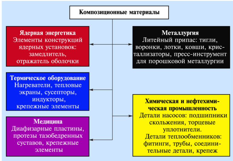
Рисунок В.2 – Применение углерод-углеродных композиционных материалов в различных областях народного хозяйства [5]

Важнейшее достоинство композитов – возможность создавать из них элементы конструкций с заранее заданными свойствами, наиболее полно отвечающими характеру и условиям работы. Многообразие волокон и матричных материалов, различных схем армирования, используемых при создании композитов, позволяет направленно регулировать прочность, жесткость, уровень рабочих температур и другие свойства путем подбора состава, соотношения компонентов