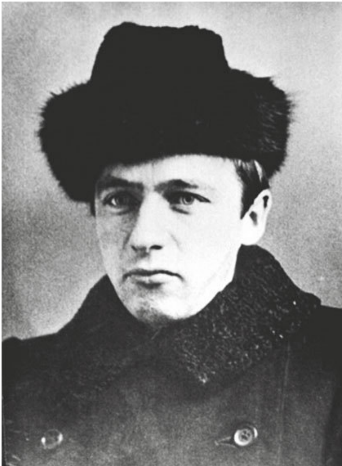
Виктор Владимирович Хлебников (1885-1922)