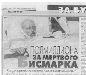
Фото 1. Мертвый Бисмарк.

Интересно, что после смерти с телом умершего часто производят определенные действия, направленные на приведение «в норму» этих полностью раскрытых частей тела: глаза закрывают, нижнюю челюсть подвязывают платком, руки и ноги связывают (Фото 1).