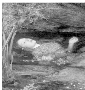
Рис. 1 Утонувшая Офелия

Только в первые минуты смерти тело человека максимально расслабляется (ср. «покойник» – от покой), сверхконтроль сознания покидает тело, и последнее становится объектом/предметом (ср. «мертвецки пьян», а, значит, падает как куль). У тех, кто профессионально занимается перевозкой-переноской таких только что умерших тел существуют специальные приемы перемещения таких абсолютно пластичных, «текущих» тел. В силу этой причины многие техники релаксации в качестве идеального, т. е. максимально расслабленного объекта используют образ тела умершего человека (сравни, «позу мертвого человека» из йоги). Мертвое тело занимает ряд важных для тотального расслабления позиций: руки и ноги полностью раскрываются, отпадает нижняя челюсть, глаза приоткрываются. На картине известного английского художника Джона Эверетта (Рис. 1) утонувшая Офелия изображена именно так: с широко открытыми глазами, ртом и руками ладонями вверх 1 .