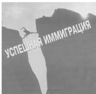
Фото 2. Модель успешной иммиграции

Отсутствие инициации при «переходе», например, при смене места жительства, страны проживания, рождает мучительное чувство ностальгии. В каком-то смысле, это нонсенс. Мы жители одной страны – Земли! Но разделенность на государства, политические системы, вероисповедания рождает «переходы» и их проблему. Хорошей иллюстрацией идеи перехода применительно к проблемам иммиграции служит реклама одного из агентств, оказывающих помощь в «успешной» иммиграции (Фото 2).