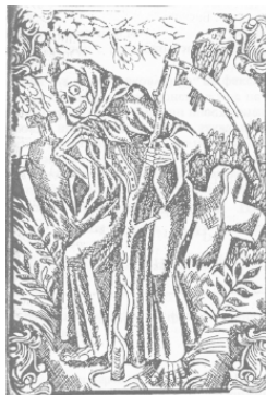
Рис. 3 Традиционное изображение смерти – с косой

Первое, что происходит при правильном засыпании – уходит чувствительность из ступней ног. «Как косой подрезала!» – это о Смерти. Нам привычнее уснуть на боку, спрятав руки под подушку и провалившись в сон. С этой позиции и как переход к следующему виду смерти представляет интерес отрывок о смерти философа Сократа – опытного умирающего, знающего толк в этом процессе: