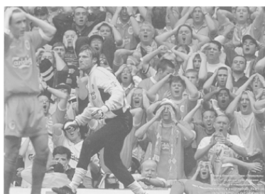
Фото 5. Ну, дает!

Этот вид смерти вытекает из перехода психически здорового человека в психически больного (мы говорим в «ненормального»), что является собой смерть прошлой личности (сущности, Self, Эго и др.). Это напрямую связано с потерей контроля со стороны сознания и проявляющимся страхом (слова поэта «не дай нам Бог сойти с ума!»). Чувства и контроль связаны между собой. Мы теряем контроль («срываемся») тогда, когда «нас доведут», т. е. когда сила чувств будет избыточна. Интересно наблюдать следующую «телесную мизансцену»: в момент, когда футбольный защитник забивает гол в свои ворота, – весь стадион, все болельщики данной команды хватаются за голову . Если бы это было возможно, – они просто лишили бы себя головы (см. Фото 5)! Отсюда и выражение «без царя в голове», т. е. человек, не контролирующий свои действия, не способный соображать.