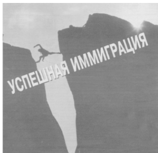
Фото 2. Модель успешной иммиграции

Отсутствие инициации при «переходе», например, при смене места жительства, страны проживания, рождает мучительное чувство ностальгии. В каком-то смысле, это нонсенс. Мы жители одной страны – Земли! Но разделенность на государства, политические системы, вероисповедания рождает «переходы» и их проблему. Хорошей иллюстрацией идеи перехода применительно к проблемам иммиграции служит реклама одного из агентств, оказывающих помощь в «успешной» иммиграции (Фото 2).