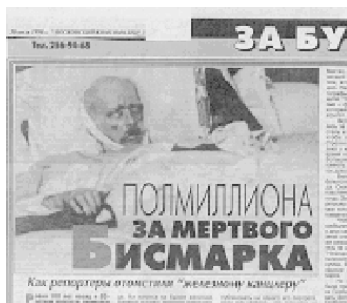
Фото 1. Мертвый Бисмарк.

Интересно, что после смерти с телом умершего часто производят определенные действия, направленные на приведение «в норму» этих полностью раскрытых частей тела: глаза закрывают, нижнюю челюсть подвязывают платком, руки и ноги связывают (Фото 1).