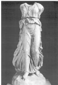
Фото 4. Идеал рожаящей женщины по Игорю Чарковскому