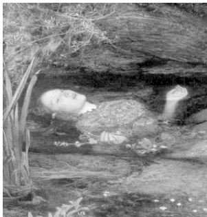
Рис. 1 Утонувшая Офелия

Интересно, что после смерти с телом умершего часто производят определенные действия, направленные на приведение «в норму» этих полностью раскрытых частей тела: глаза закрывают, нижнюю челюсть подвязывают платком, руки и ноги связывают (Фото 1).