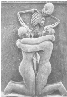
Фото 3. Смерть пытается разъять влюбленных

Другой ответ мы можем найти на одном из могильных камней, изображающих влюбленных, крепко прижимающих друг друга (Фото 3). Смерть на этом изображении, вторгаясь в этот контакт, – пытается разъять влюбленных.