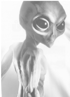
Рис. 5 Изображение пришельца