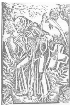
Рис. 3 Традиционное изображение смерти – с косой

такта с тем, на чем мы лежим), еще реже мы располагаем руки открытыми ладонями вверх поверх одеяла (по А. Солженицыну – это один из видов пыток политических заключенных в ГУЛАГе), совсем не отпускаем нижнюю челюсть (см. ниже), не разваливаем ступни ног. И самое главное – мы не привычно сваливаемся в сон (строки культовой песни «если смерти – то мгновенной!»), а медленно ждем приближения Гипноса. В таком случае нам становится понятным смысл изображения смерти не с автоматом Калашникова или с топором, а именно с косой.