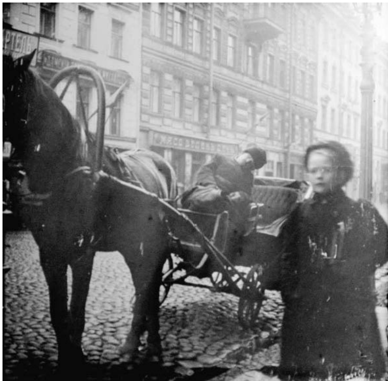
Троицкая улица. 1909 год

онально квартплате, получаемой домовладельцами с жильцов). С фасадом архитектор поступал, как провинциальная красавица с макияжем: чем гуще, тем лучше. Только вместо румян и белил он накладывал штукатурный узор, почерпнутый по преимуществу из немецких альбомов по зодчеству.