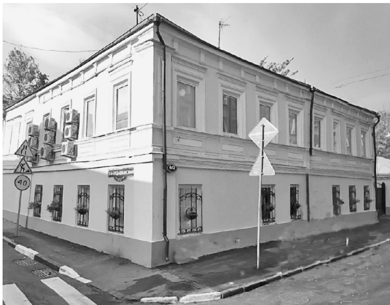
Большая Ордынка, № 6. Современная фотография

Дома № 6/2, стр. 8 и 10 построены в середине XIX века. А раньше здесь располагался сад, выходящий на Большую Ордынку и 2-й Кадашевский переулок. Принадлежали эти дома купцам Калмыковым, торговавшим посудой на Балчуге – известной улице лавочников и мелких торговцев. Очень может быть, что и на Большой Ордынке у Калмыковых были небольшие лавки. Дом на углу с Кадашевским переулком был жилым, а в другом – одноэтажном – находились торговые помещения. Эти здания прекрасно иллюстри-