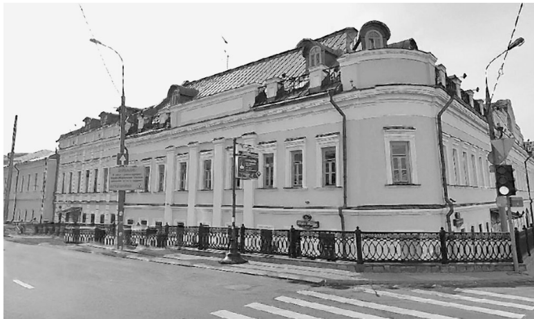
Большая Ордынка, № 2. Современная фотография

Следующий по западной стороне дом (№ 4, стр. 1), немного выступающий за красную линию Большой Ордынки, датируется приблизительно 60-70-ми годами XVIII века. В то время он имел барочную отделку парадного фасада и принадлежал известному табачному и винному откупщику Кузьме Матвеевичу Матвееву – большому любителю барокко. Кузьма Матвеевич был крестьянином села Хавки Тульской губернии, но благодаря своим деловым качествам и немалой доли везения стал успешным московским купцом. В 1749 году при Елизавете Петровне был восстановлен табачный откуп – предоставляемое государством частному лицу исключительное право на торговлю товаром, на который