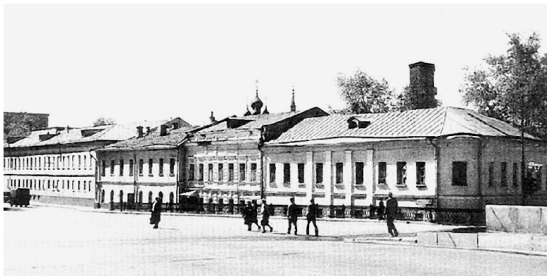
Начало Большой Ордынки. Фотография 1988 г.

Москве! Одно из таких заведений встречало всех проходящих и приезжающих из центральных районов Москвы на Большую Ордынку. Трудно было устоять перед соблазном зайти. А как замоскворецкие купцы любили «питейные дома» – это отдельная история. И вот уже Ольга Дмитриевна Потапова, молодая жена купца из пьесы А. Н. Островского «Сердце не камень», жалуется подруге: «Я шла замуж-то, как голубка была, а муж меня через неделю по трактирам повез арфисток слушать; сажал их за один стол со мной, обнимался с ними; а что говорили, так у меня волоса дыбом подымались!» 11