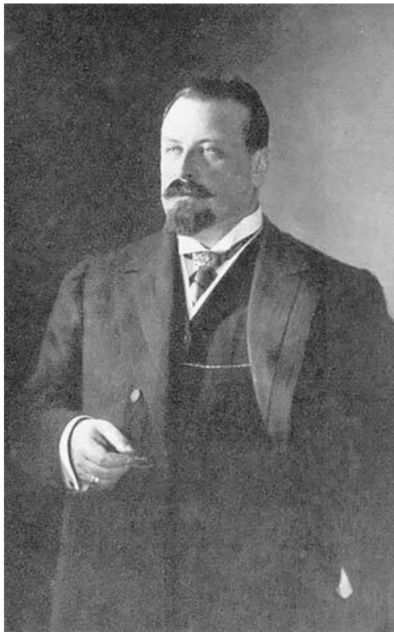
Министр земледелия и госимуществ А. Н. Наумов