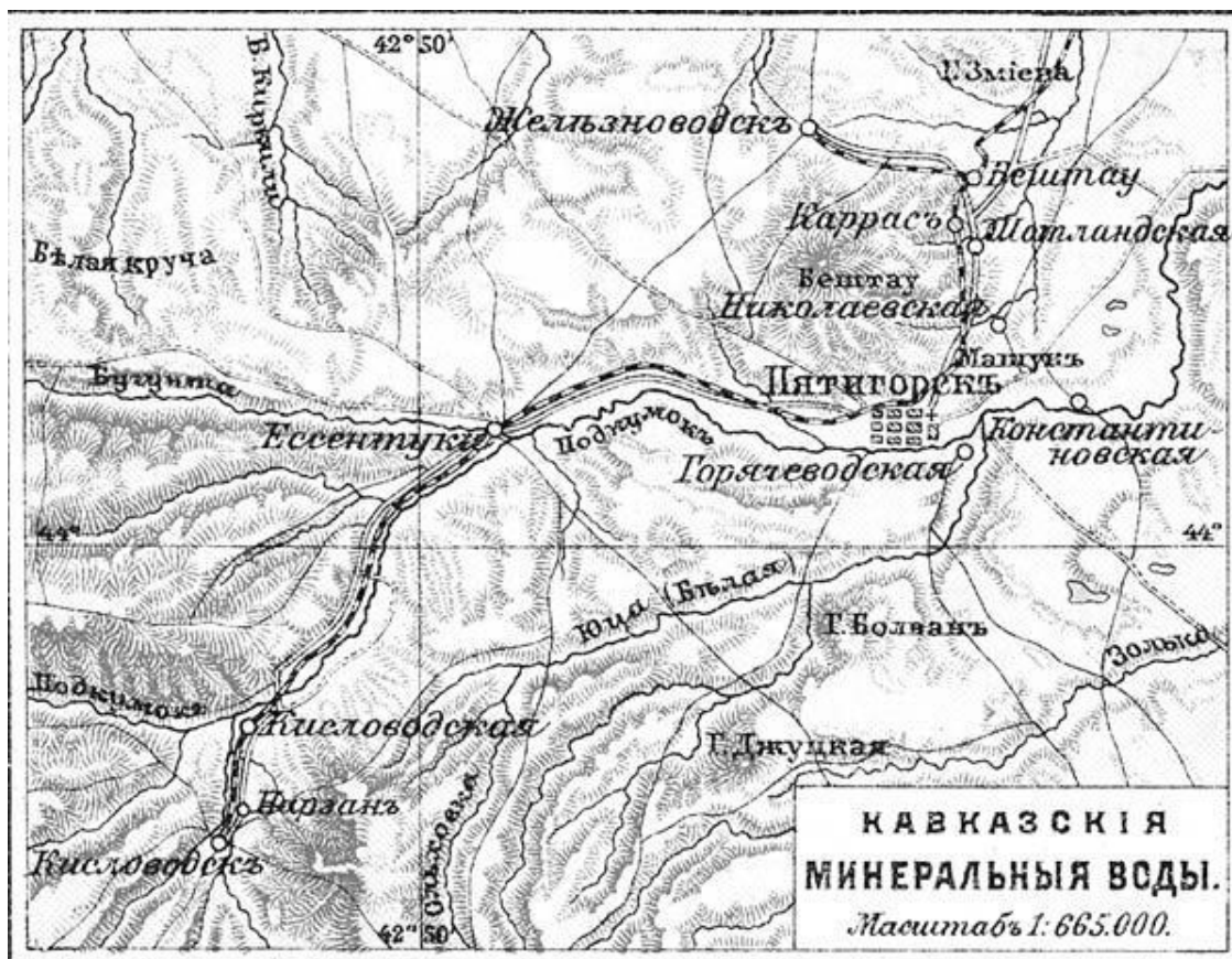
Дореволюционная карта 1905 г. региона Кавказские Минеральные Воды