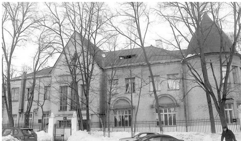
Бывший санаторий АХО ВЦИК «Химки», где главврачом

границей не хотели и вопрос с этим вполне элитарным мероприятием все-таки вскоре пробили. Для лечения сотрудников аппарата ЦК РКП(б) в апреле 1921 года на основании секретного циркуляра президиума ВЦИК был создан валютный фонд ЦК партии большевиков, которым распоряжались исполнительные органы ЦК – политбюро, оргбюро и секретариат. Персональные постановления об отправке за границу на лечение высшей номенклатуры обычно утверждались на основании рекомендаций Лечебной комиссии ЦК РКП(б) (структурное подразделение Управления делами ЦК РКП(б) с мая 1921 года) и оформлялись протоколами с грифом «Совершенно секретно».