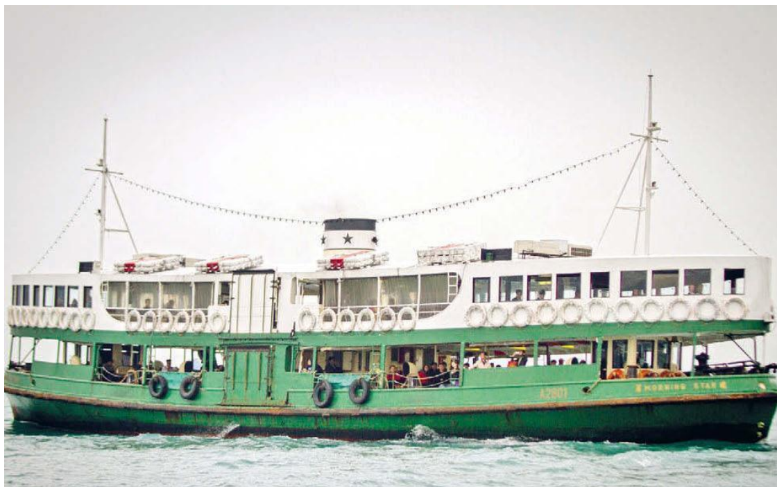
Паром на остров Гонконг