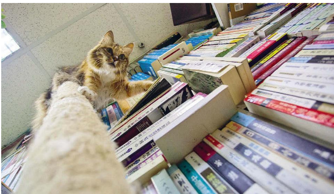
В этом магазине кошки гуляют по книжкам

Посетители приходят сюда не только за книгами, но и за кошками. Погладить, поиграть, принести еды. Многие заглядывают каждый день перед работой. Погладил котика – зарядился хорошим настроением на весь день!