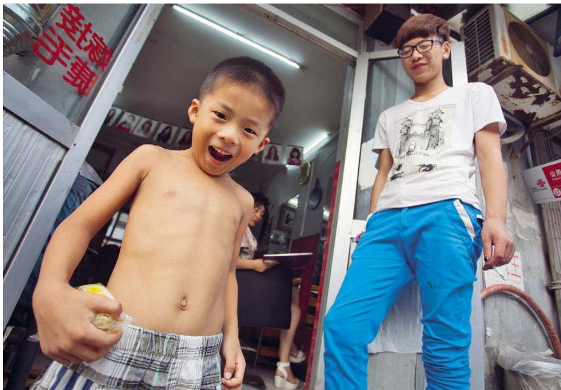
Будущий Брюс Ли или Джеки Чан?

За порядком в хутонах следят дружинники. Такие же, как в Советском Союзе, с красными повязками. Активные местные жители, наделенные правом свистеть в свисток и призывать к порядку. Обычно «в наряде» пара местных бабушек, которые знают все о жизни в районе. В их задачи входит помогать прохожим.