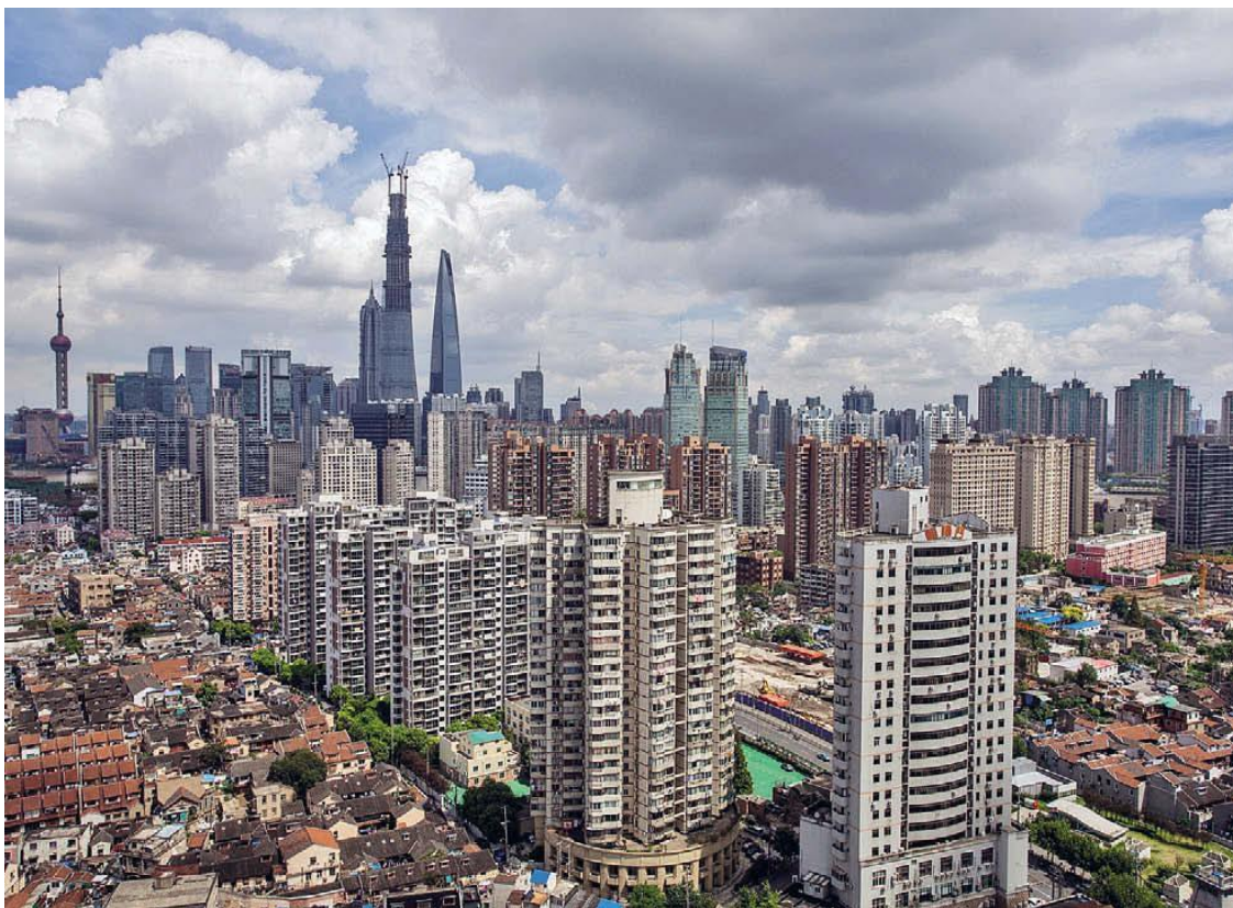
Шанхай – город контрастов!