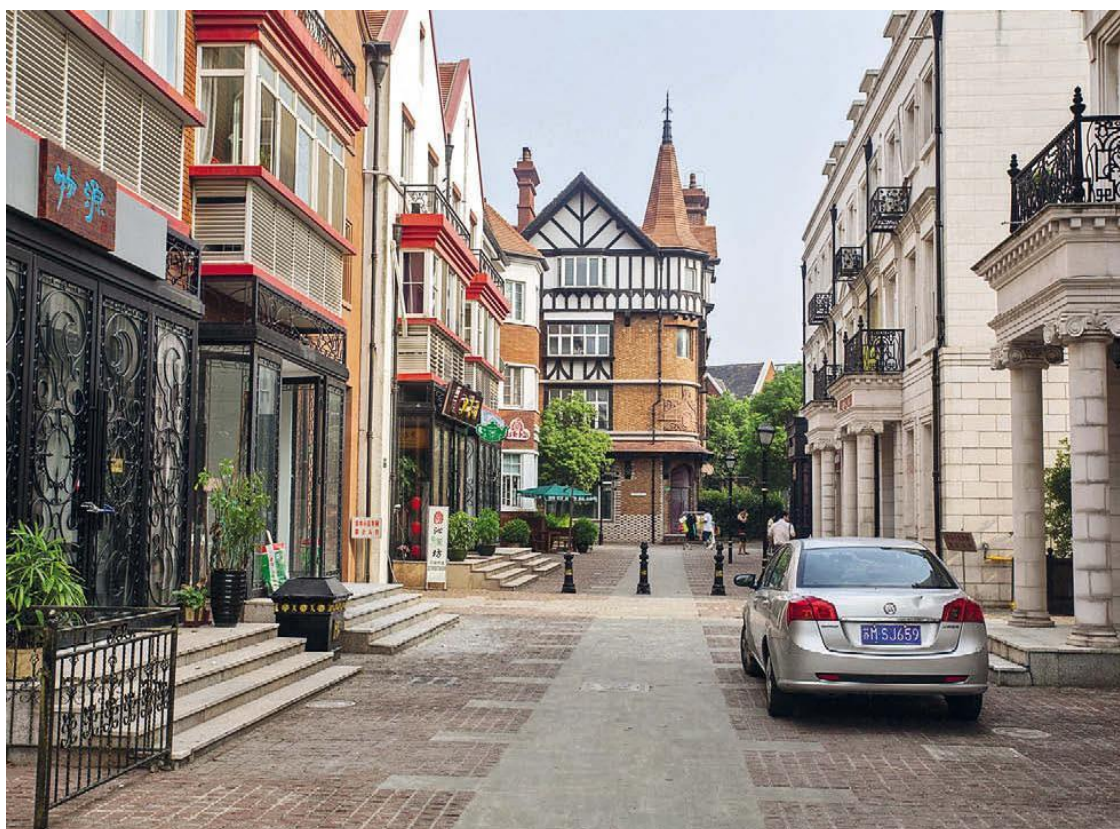
Китай тянется к Европе, но все равно остается Китаем

Жителей здесь так же немного, но люди на улицах встречаются. Почти все они туристы: сами китайцы, которым любопытно, или молодожены с фотографами.