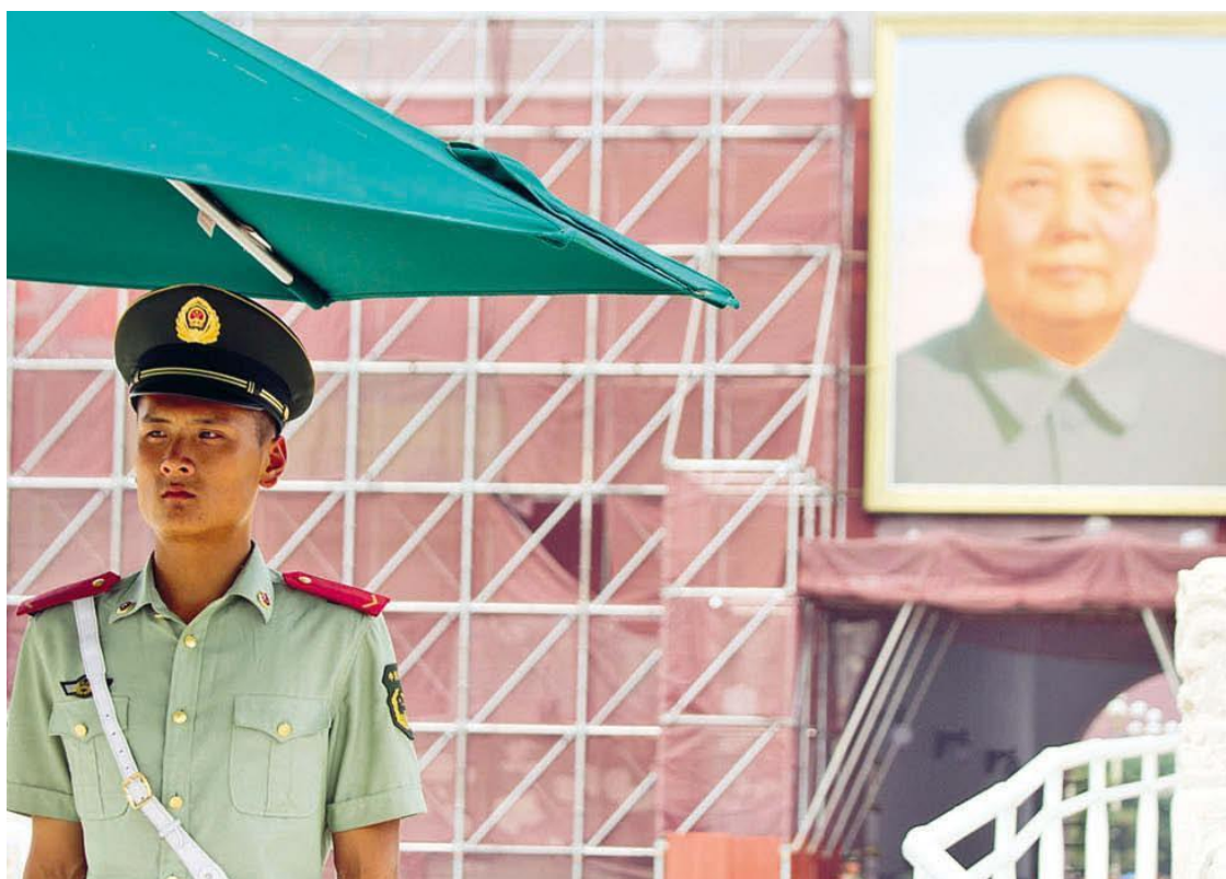
Китайский «пост номер один». У стен запретного города всегда дежурит почетный караул

Есть стереотип про «одинаковых китайцев» и много шуток на эту тему. Это неправда, они очень разные и внешне отличаются друг от друга не меньше, чем жители России. Стоит хоть на день попасть в Пекин, и вы в этом убедитесь. А еще китайцы очень любят фотографироваться. И сами будут вас просить об этом, особенно если у вас светлые волосы.