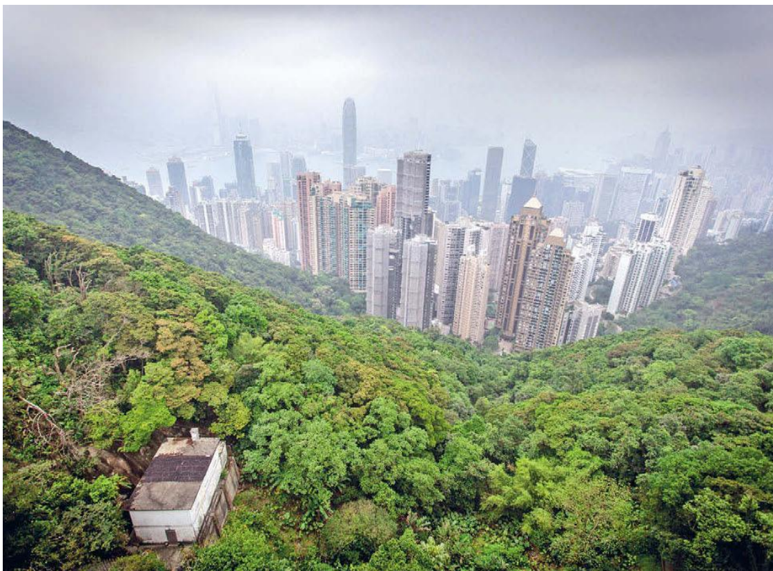
Этот вид на Гонконг фотографируют миллионы