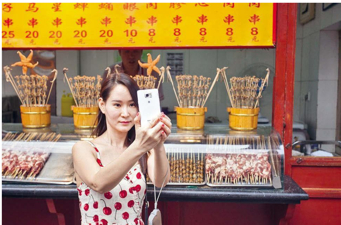
Жареные жуки и скорпионы большие забава для туристов, чем еда для пекинцев

Каких-то особенных достопримечательностей в Пекине нет. Много парков и дворцов, ну и все на этом. Еще торговые центры. Но ими никого не удивить: несколько лет назад сюда приезжали жители провинций ради шопинга, но сегодня в их городах открылись такие же магазины. Страна развивается.