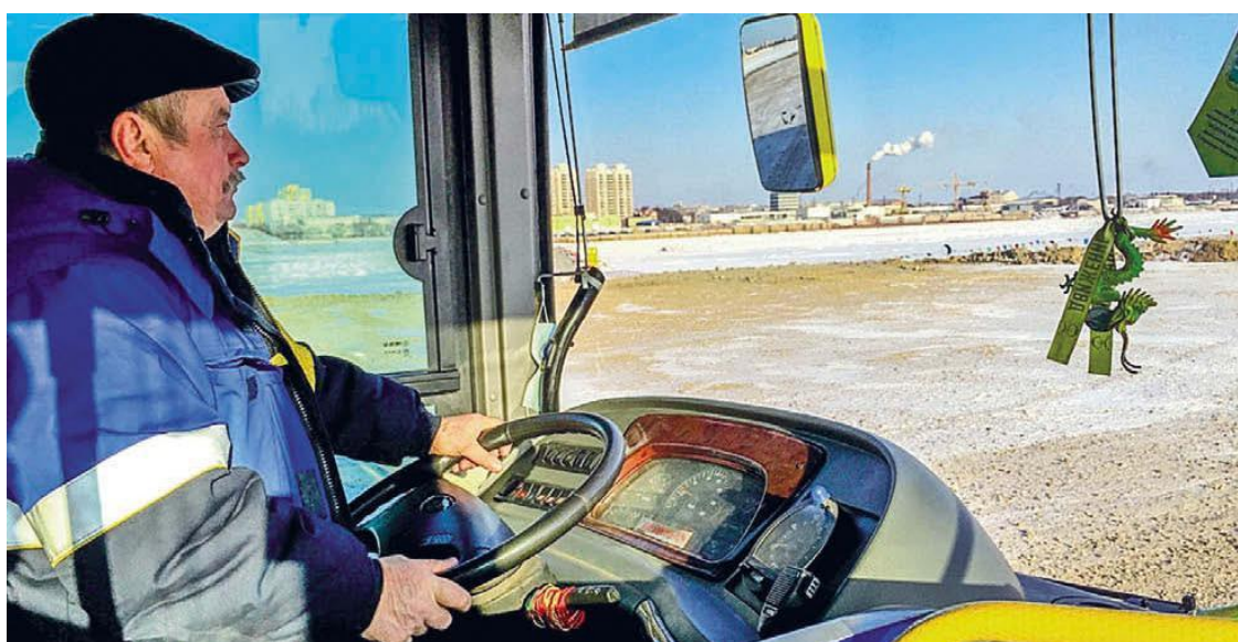
Зимой – водитель автобуса, летом – капитан катера

Если приехали за покупками – вы уже на месте. Сразу на выходе из речного вокзала вас ждут два больших торговых центра – «Остров» и «Юань Дун», они хорошо видны с российского берега.