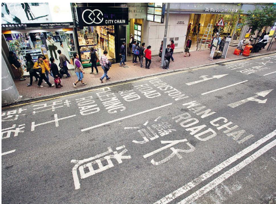
Улица в Гонконге