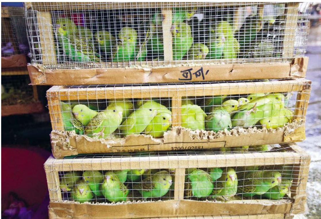
Грузят попугаев бочками

В этом магазине продают только шиншиллы. Это дорогие декоративные игрушки. Самое меньшее, что вы заплатите за пушистого зверька, – несколько сотен юаней. Белые шиншиллы – самые дорогие, стоят от двух тысяч. За шиншиллами неплохо следят, у них чистые и аккуратные клетки. Но зверьки все равно грустные.