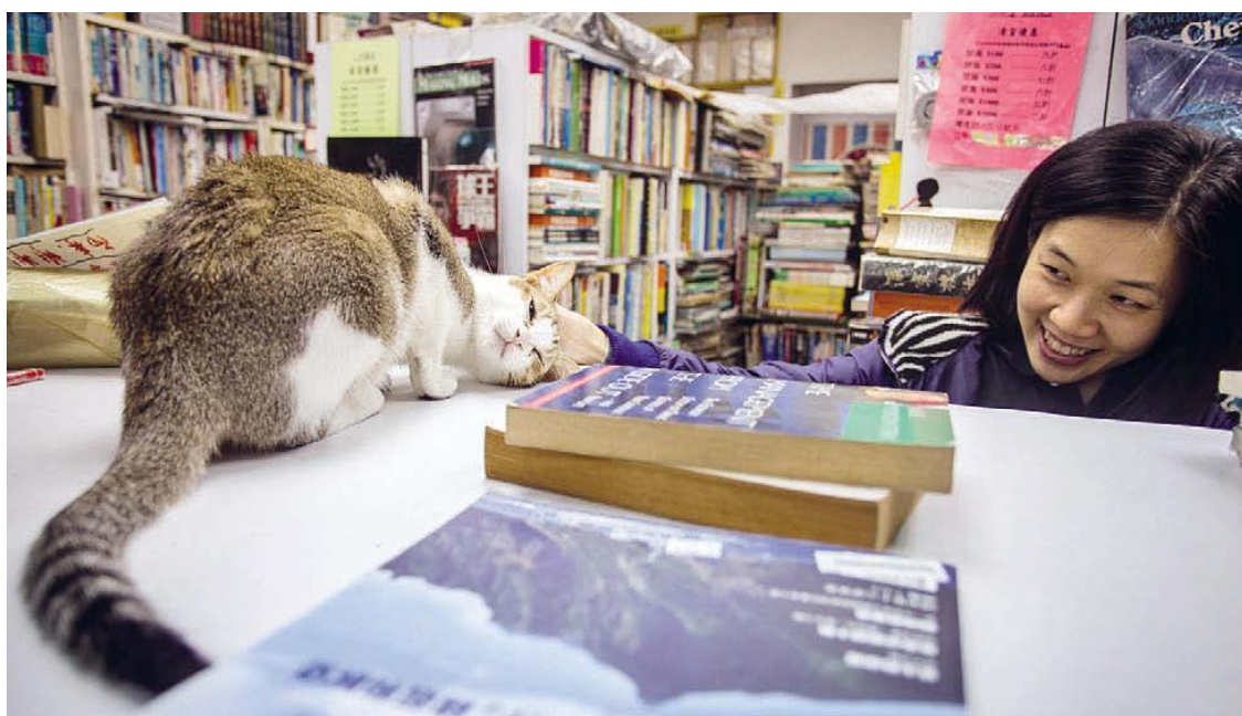
Непонятно, что здесь важнее, книжки или кошки