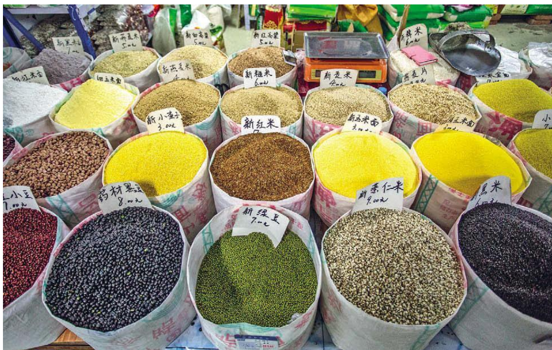
Китайские специи на рынке

Посетить приграничный город Хэйхэ может любой житель России, если у него есть загранпаспорт. А вот ехать дальше по закону нельзя. Теоретически можно добраться без визы даже до Пекина или устроить путешествие по Китаю. Но на практике эта авантюра может плохо обернуться. К тому же при покупке билета на поезд или автобус у вас наверняка проверят паспорт. Но колорита хватит и в Хэйхэ. Особенно если вы решите поехать туда в январе, когда на улице минус тридцать.