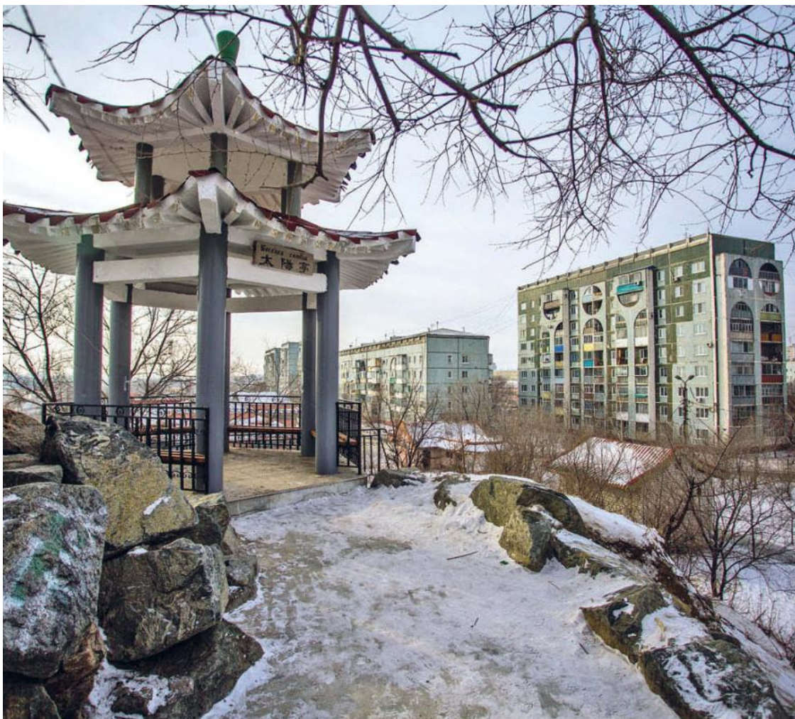
Беседка солнца в парке российско-китайской дружбы