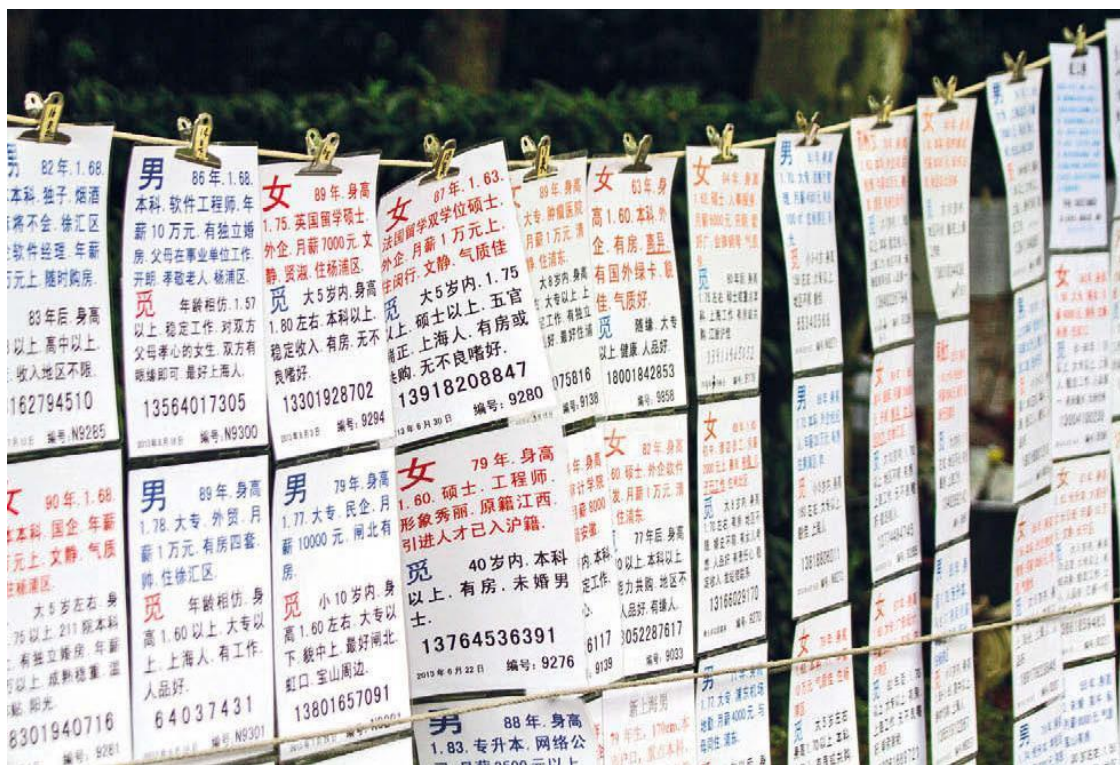
Анкеты четко структурированы