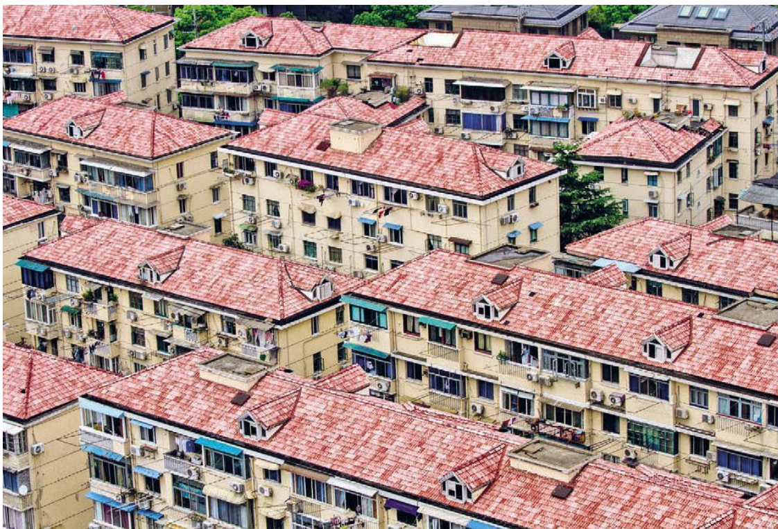
Такие дома уже устарели, и их активно сносят