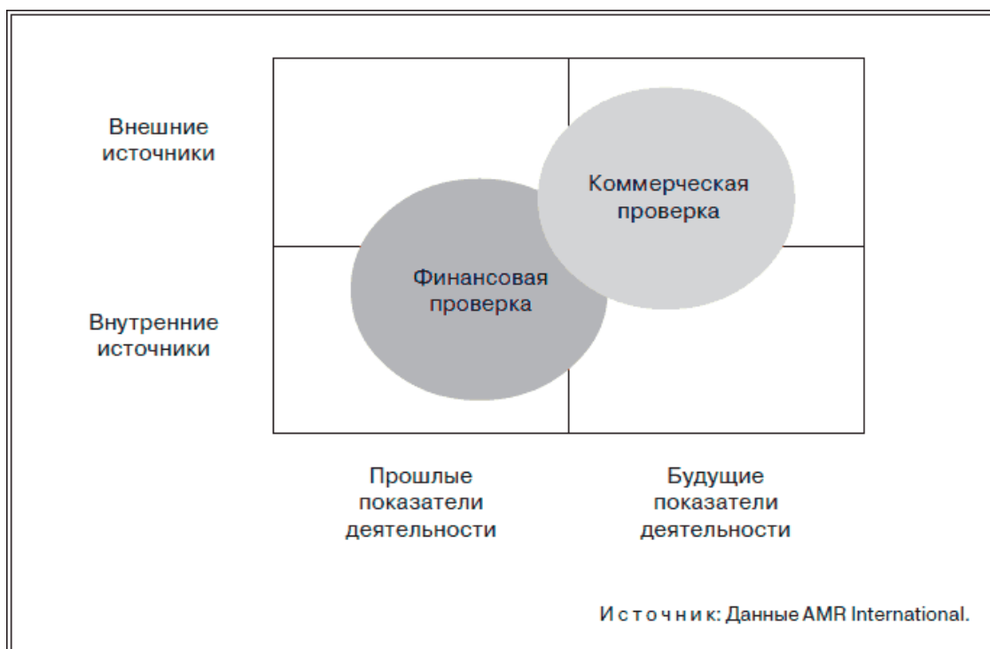
Рисунок 1.1. Проверка чистоты сделки: соотношение ее коммерческой и финансовой составляющих

Удачный подбор клиентов всегда является хорошей отправной точкой для принятия решения о приобретении компании. Это означает не только то, что покупатель может осуществлять перекрестные продажи, но также и то, что он понимает, как взаимодействовать с данной группой клиентов. Поэтому вовсе не удивительно, что первоначально коммерческая проверка фактически представляла собой расширенное изучение отзывов клиентов.