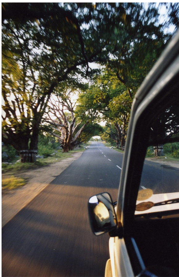
Тамарисковые деревья вдоль дороги.

Bred'n omlet выглядел здесь как две лепёшки омлета, между которыми, проложенный кольцами лука, лежал кусок белого хлеба. Конечно, белого. Другого здесь нет. Есть, собственно, индийский хлеб – разнообразные лепёшки.