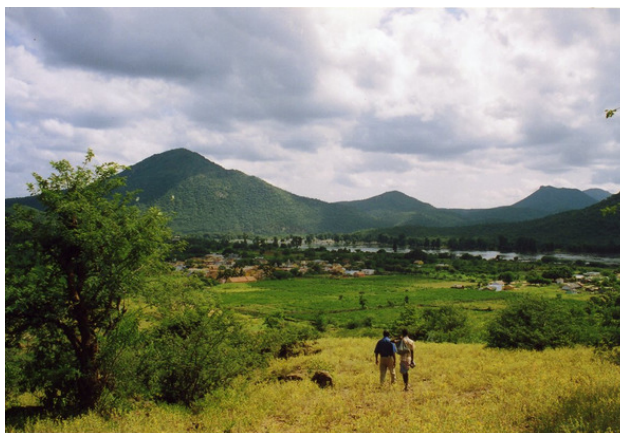
Вид на деревню Хогенкали от карбонатитового проявления.

Проявление карбонатитов оказалось большой дайкой карбонат-пироксеновых пород с обильным апатитом, согласно залегающей в моноклинали, либо зоне расщеливания гнейсов. Дайка содержит обильные ксенолиты гнейсов, переработанных в сиениты и кварцевые сиениты, ксенолиты карбонат-пироксеновых пород без апатита, кое-где – пегматоиды полевошпат-ортопироксенового состава, полевошпат-биотит-кварцевые пегматоиды, иногда – секущие карбонат-apatитовые прожилки с теньями полосчатости.