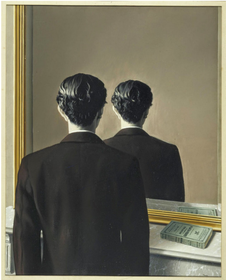
Рис. «Воспроизведение запрещено» (художник Магритт Рене, 1937 г.)