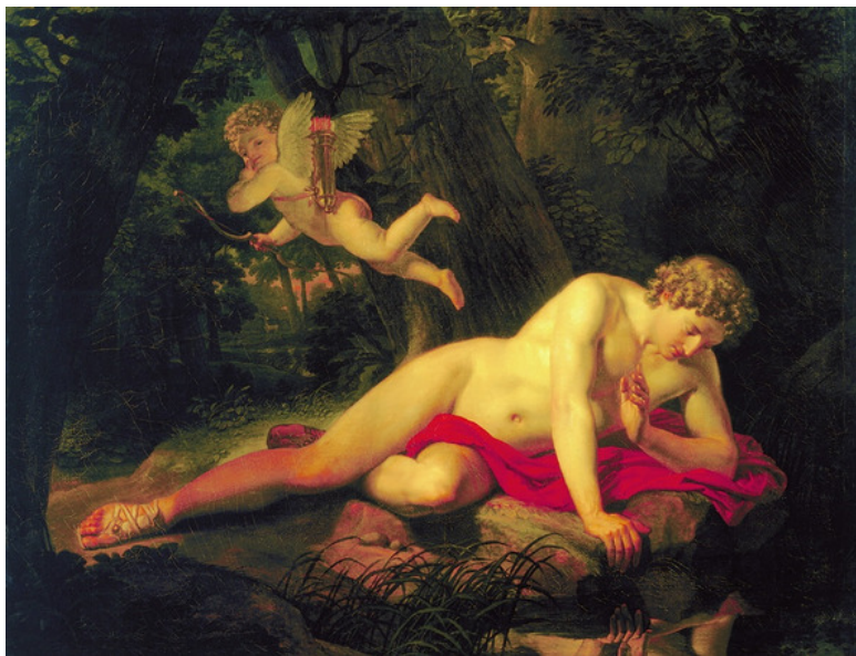
Рис. Картина аллегорического жанра «Нарцисс, смотрящий в воду» (художник Брюллов К. П.).

Таким образом, «идеальное Я» человека нередко оказывается снаружи. Крайняя степень отделения от индивида его «лучшей» части – это мифический сюжет о Нарциссе, прекрасном юноше, который влюбился в свое отражение, потому что не знал, что увиденное им изображение и есть он сам.