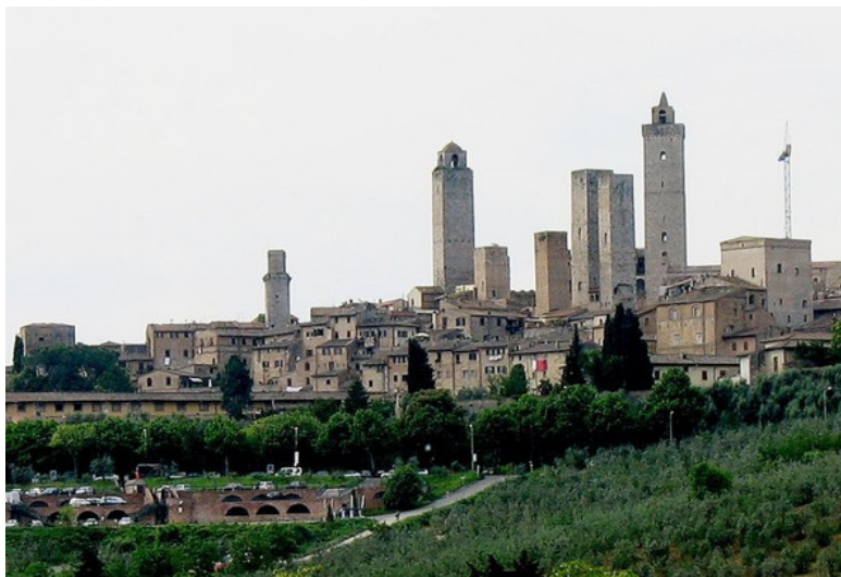
Рисунок. Башни Сан-Джиминьяно

ся точный размер, на сколько футов можно надстроить башню, но никому и никогда не разрешалось надстраивать башню выше, чем башню Синьории. Если же заслуг становилось больше, то разрешалось рядом возводить вторую башню. За провинность могли срезать верхушку башни. Как, например, дом Данте во Флоренции, который стоит до сих пор обезглавленный». 5 Башни символизировали заслуги, могущество и богатство проживавших в этом городе знатных семейств.