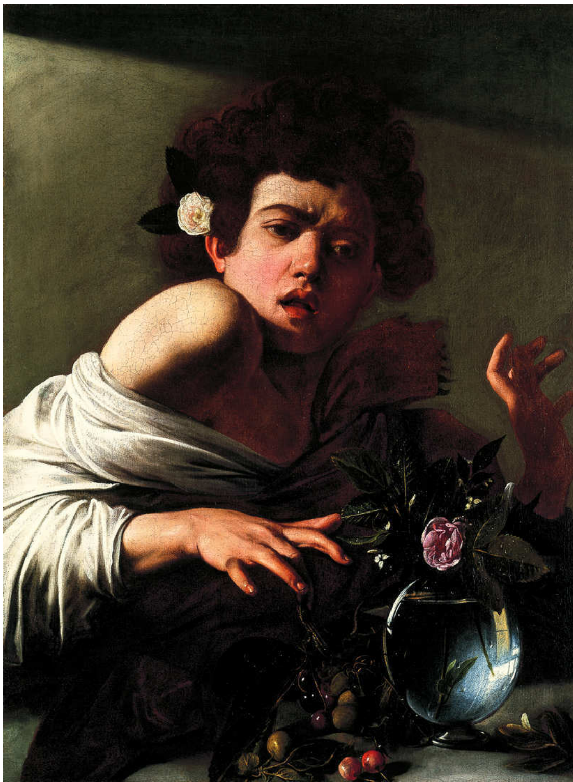
Мальчик, укушенный ящерицей. Ок. 1595. Холст, масло. Национальная галерея, Лондон

Разумеется, при желании можно рассматривать «Мальчика, укушенного ящерицей» как предостережение от сексуальных излишеств. Если вы не вполне понимаете значение укушенного пальца и розы с шипами, то какой-нибудь соотечественник художника мог бы объяснить вам, ухмыляясь, что на уличном жаргоне слово «ящерица» означало «пенис». И укус, от которого пострадал бойкий бездельник с цветком за ухом, был намеком на заражение венерической болезнью, неизбежное для тех, кто имел дело с девицами, чье общество предпочитали Карава-