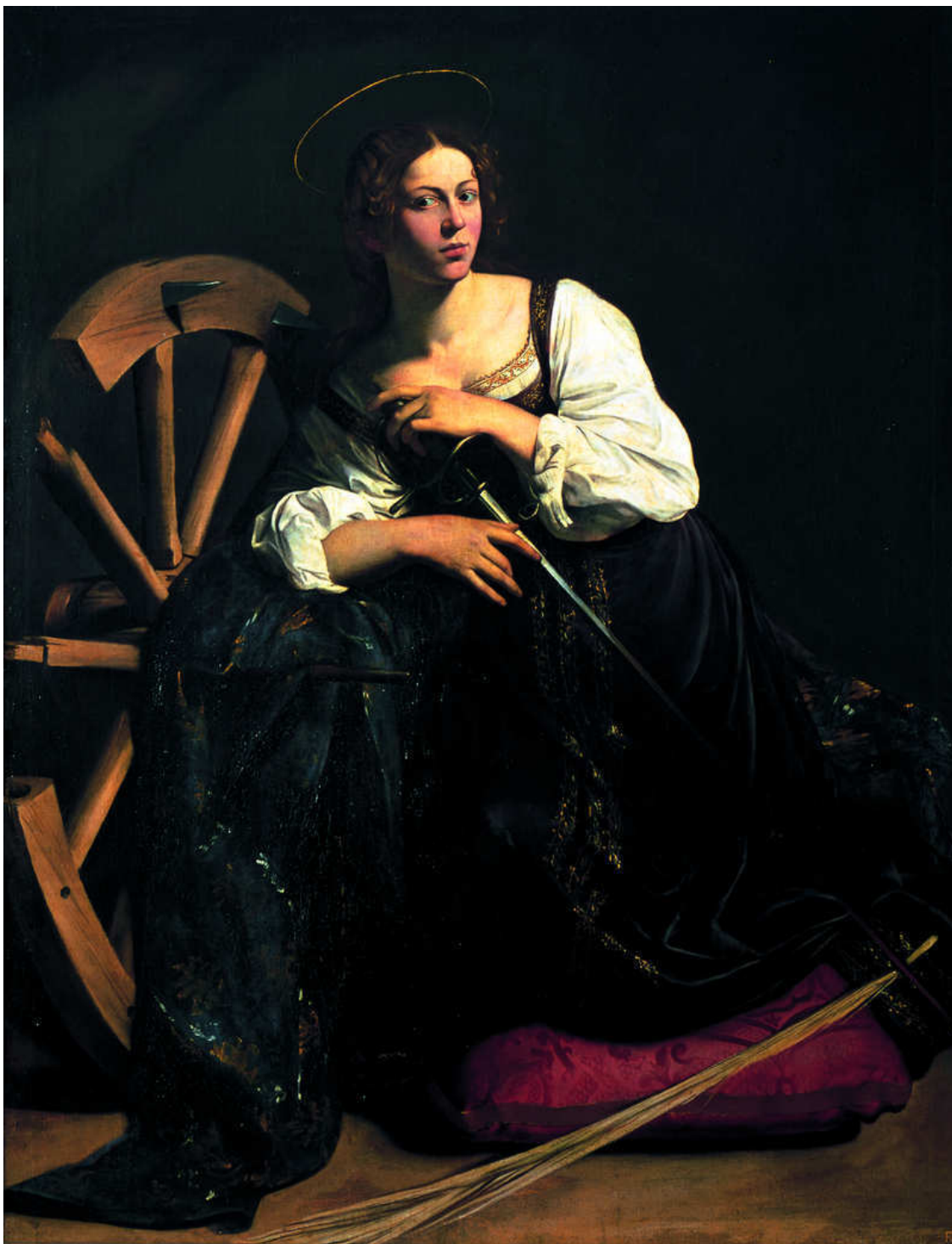
Святая Екатерина Александрийская. 1598. Холст, масло. Собрание Тиссен-Борнемиса, Мадрид

Поставленная перед художником задача, по всей вероятности, одновременно вдохновляла его и пугала. Это была самая крупная работа из всех, какие он когда-либо выполнял, – и по своим физическим размерам, и по значимости. До сих пор всегда, даже выполняя «спецзаказ» на «Медузу», Караваджо оставался хозяином положения; занимался он исключительно станковой живописью и писал с натуры в своей студии при ярком освещении; он сам определял, какие фигуры будет изображать и как они будут расположены на полотне. Теперь же он должен был учитывать указания Куантреля и даже, возможно, потолочную живопись д’Ар-