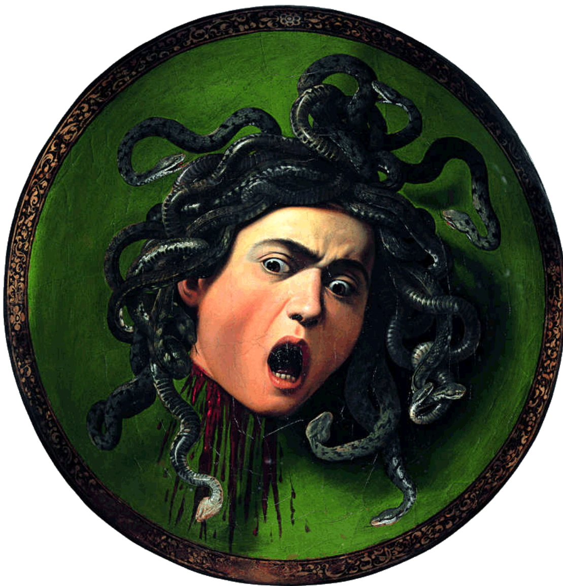
Голова Медузы. Ок. 1598–1599. Холст поверх деревянного щита.

Театр жестокости в Риме процветал: тут были и обезглавливания, и сожжение еретиков, вроде Джордано Бруно, и еженедельное выставление на всеобщее обозрение повешенных преступников. Атмосфера насилия не могла не повлиять на Караваджо. Он входил в ближайшее окружение кардинала и потому имел право носить шпагу, точнее, ходить в сопровождении мальчика-оруженосца. Тем не менее полиция не раз пыталась задержать его за ношение оружия без соответствующей лицензии, в ответ на что он высокомерно отстаивал свои исключительные права.