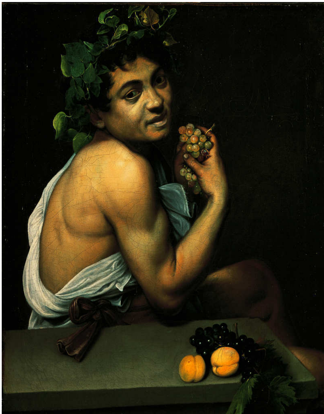
Большой Вакх. Ок. 1593–1594. Холст, масло. Галерея Боргезе, Рим

Тот факт, что Караваджо не делал предварительных набросков, это не только признак феноменальной координации между глазом и рукой, но и свидетельство методологического бунта. Disegno 5 , означающее как процесс рисования, так и общую концепцию работы художника, предписывалось всеми руководствами по теории и практике живописи как единственно правильный способ создания произведений изобразительного искусства. Рисование было не просто техникой, а идеологическим принципом. Правда, можно вспомнить венецианцев, и в