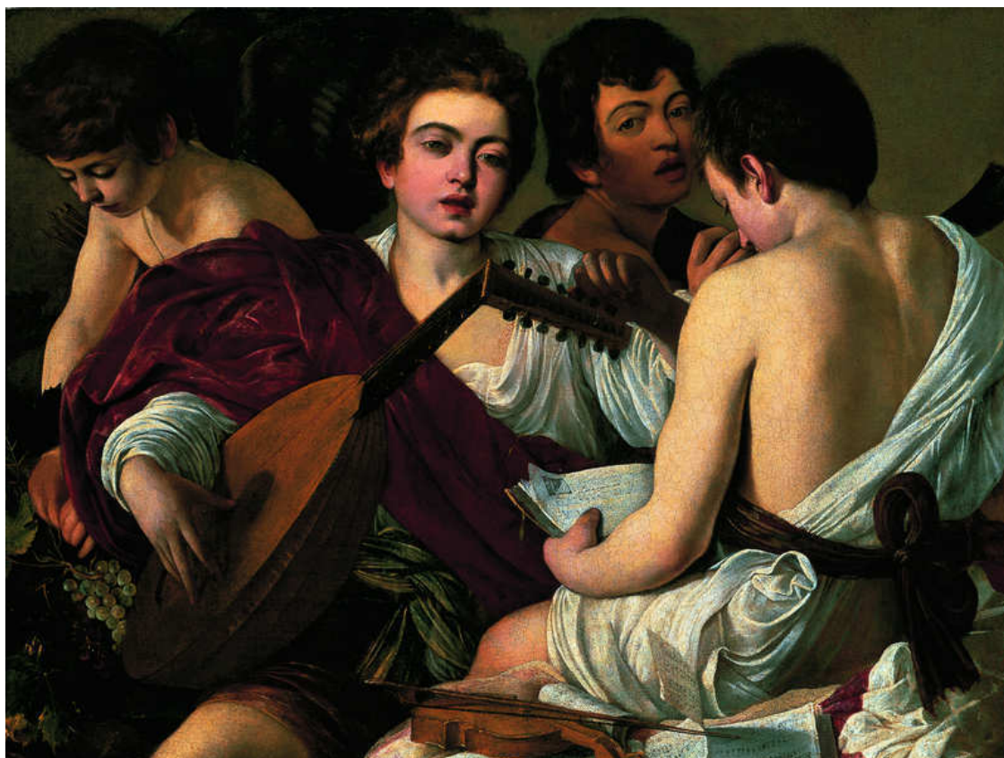
Музыканты. Ок. 1595–1596. Холст, масло. Метрополитен-музей, Нью-Йорк

которым римские кардиналы достигали вершин в неофициальной аристократической иерархии, было развитие художественного вкуса и меценатство. Двумя наиболее сильными ветвями религиозной власти в Священном городе были в то время суровая и высокомерная испанская и более либеральная и приближенная к земной жизни французская. Фарнезе ориентировались на Испанию и смертельно враждовали с профранцузскими Медичи. У них была своя команда художников, к которой примкнули блистательные братья Карраччи. Дель Монте поставил себе задачу найти другой многообещающий талант. Для этого оказалось достаточным перейти улицу, заглянуть в лавку Спаты и увидеть там «Шулеров». Он, по всей вероятности, сразу понял, что попал на золотую жилу, и предложил Караваджо кров и стол: студию на верхнем этаже своего палаццо Мадама, а главное – покровительство, и не только собственное, но и целого круга лиц, занимавших высокое положение в обществе или в церкви, бывавших в палаццо дель Монте на обедах и концертах и проводивших время в беседах на возвышенные темы.