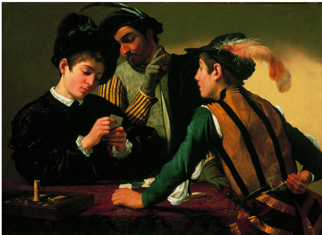
Шулеры. 1596. Холст, масло. Музей Кимбелла, Форт-Уэрт, Техас